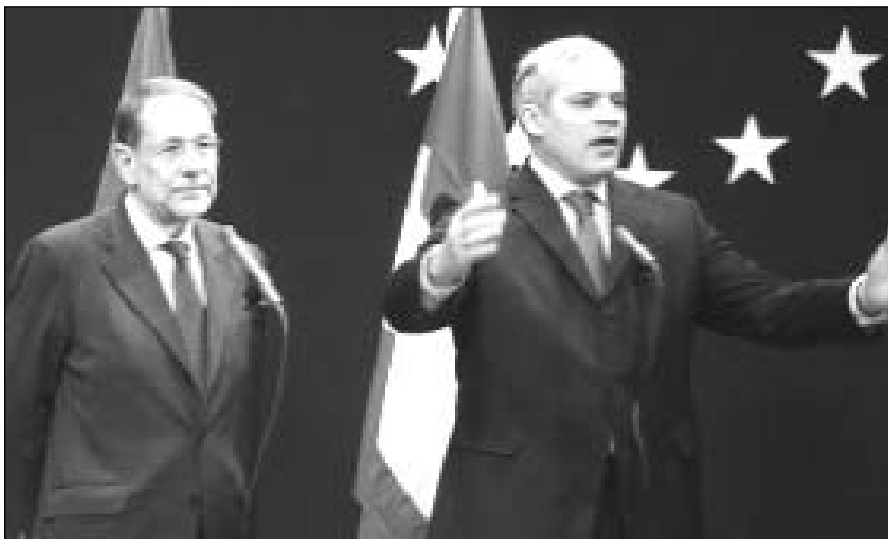
Javier Solana és Boris Tadić

hatósági tanulmány kidolgozásához, és az Allamközösség kettős vágányú csatlakozásra való hajlandósága feltételezte, nemkülönben a szaloniki értekezlet, melyen a nyugat-balkáni térség országainak, így Szerbia és Montenegrónak az EU-ba való társulásának eshetősége is körvonalazódott. A szerb elnök kimondottan jelentősnek nevezte azt, hogy az EU-ban most ilyen kedvező a fogadtatásunk, és maga is úgy vélte, hogy a megvalósíthatósági tanulmány csak az első, EU-integrációt célzó lépés. Ezt a stabilizációs és társulási megállapodás megkötése hivatott követni. Számunkra az európai integrációs felzárkózás kulcsfontosságú stratégiai cél, ezért ennek érdekében meg kell tennünk minden tőlünk telhetőt. Minden kérdést ebben a vonatkozásban kell szemlélünk. Minél előbb, annál jobb – mondta Tadić. Vendéglátója nem bocsátkozott időpontjóságsba, de kiemelte, ha a közeledés a következő hónapokban is ilyen ütemben halad, a stabilizációs és társulási megállapodás feltételei is megteremtődhetnek.