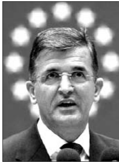
Svetozar Marović beszédét mondja