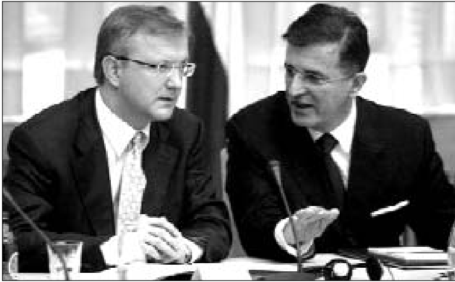
Olli Rehn és Svetozar Marović

nak a céloknak az elérésében, amelyek a megvalósíthatósági tanulmány értékeléséből következnek. Marković a kormánytól kéri, juttassa el a képviselőháznak a rendőrségről és az ombudsmanról szóló törvényjavaslatot, hogy sürgősségi eljárással bekerüljenek a képviselőházi eljárásba. Továbbá a kormány sürgesse meg a denacionalizálásról, az állami segélyről a diszkriminációellenes törvények elkészítését. Sürgős a korrupció elleni nemzeti stratégia, valamint az uniós csatlakozási nemzeti stratégia kidolgozása is.