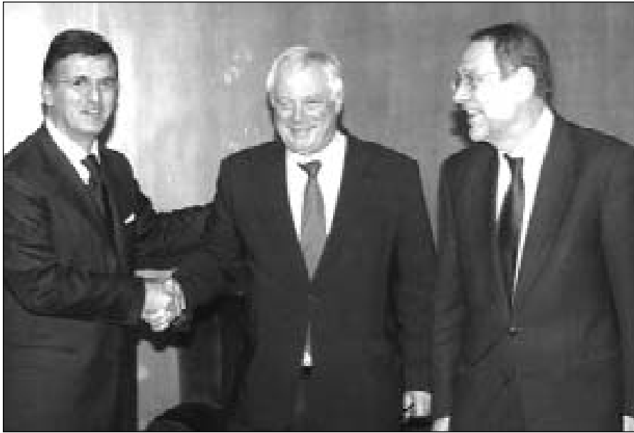
A belgrádi tárgyalásainkon sikerült elhárítani az Államközösség és az EU kapcsolataiban felmerülő akadályok többségét – jelentette ki Javier Solana, miután befejezték a megbeszéléseket Svetozar Marović elnökkel. A képen: Svetozar Marović, Chris Patten és Javier Solana