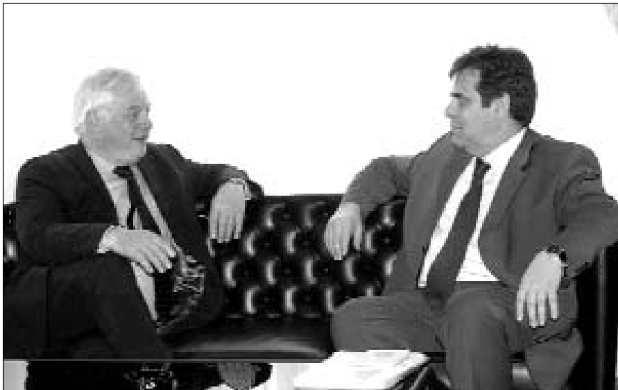
Chris Patten és Vojislav Koštunica találkozója