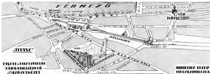
3. kép. A németvölgyi Bösörmezői úti Horthy-telep helyszínrajza a Tiszti és Tisztviselői Társasházépítő Szövetkezet prospektusában, 1927 (BFL XIV.93)

szakosodó cégek szaporodásával azután a prospektusok száma is arányosan növekedett 56 (3. kép). 1926 májusában Centrum Házépítő és Ingatlanvállalat mint Szövetkezet néven jött létre az az első nagy fővárosi társasházépítő vállalkozás, amely a háború után elsőként fogott bele az öröklakás-építést kísérő propagandába, s ezen a terepen egyrészt úttörő, másrészt éveken át a legintenzívebb reklámtevékenységet folytató cégnek bizonyult. Nemcsak a lakásokat alaprajzokkal kínáló brosúrákban rejlő lehetőségeket használta ki, 57 hanem úttörő módon terjesztette ki propagandáját a napisajtóra is.