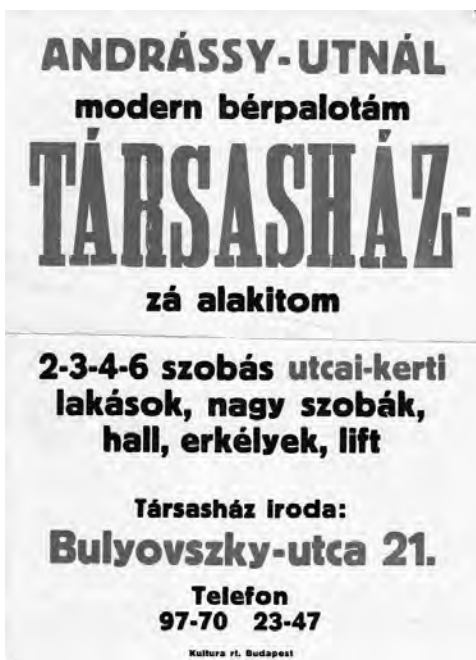
2. kép. A Baráth és Társa cég öröklakásokat hirdető villamosplakátja, 1923

Az 1924. évi törvényen alapuló társasházak építése viszont az öröklakások értékesítéséhez nélkülözhetetlenné tette a szélesebb közönséghez eljuttatott reklámot. Akár arról volt szó, hogy a leendő lakástulajdonosoktól gyűjtötték be az építkezéshez szükséges tőkét, akár arról, hogy a beruházó a már elkészült lakások eladásával jutott befektetett pénzéhez és a haszonhoz, a bérházak eladásához képest nem egy, hanem jóval több vevőt kellett egyidejűleg megnyerni az üzletnek. A lakásépítési tematikájú szórólapok és prospektusok a budapesti társasház-alapítások második szakaszában, a bérházak társasházzá alakítása során bukkantak fel először, az 1920-as évek elején. 54 A villamosok utastereiben elhelyezett hirdetőkön fekete-piros nyomású reklámlapok jelentek meg 55 (2. kép). A társasházépítés beindulásával és az arra