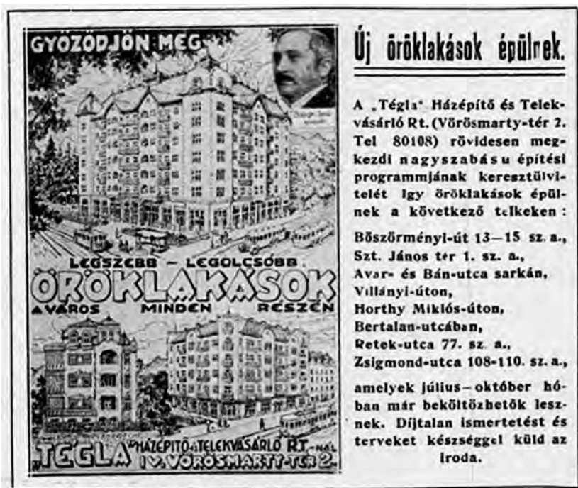
6. kép. A Tégla Házépítő és Telekvásárló Rt. társasházhirdetése látványtervekkel. Új Idők , 1931/1-27. 484.

tés terén a leghosszabb időn keresztül és a legnagyobb volumenel működő vállalkozás, így amikor a lap olykor-olykor egy-egy másik nagyobb cég vagy kisebb építési vállalkozó társasházépítő tevékenységére is ráirányította a figyelmet, 63 e cikkek szórványos, eseti jellege megfelelt az ebben az üzletágban tevékenyke-