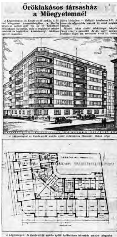
5. kép. Meg nem valósult társasház reklámja távlati képpel és alaprajzzal a Lágymányosi utca és a Kende utca sarkán. Magyarság , 1932. április 17. 26. 60

is megjelentetett, amelyek öröklakásos házait a társasház-propagandába ágyazottan reklámozták.