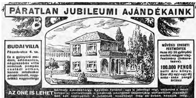
1. kép. A kútvölgyi Fészek utca 4. szám alatti villa reklámja. Pesti Hírlap , 1933. december 17.

elején került sor. 42 Majd az akciót megismételve 1935 karácsonyán a lap ugyanezen keretek között újból nyereményjátékot hirdetett, 1936 tavaszán sorsolva ki a szomszédos telken felépített második házat. 43 A Fészek utca 4. és 6. szám alatti kútvölgyi villák felépítése és odaajándékozása mögött azonban nem állt az Új Idők hez hasonló koncepció. Az Új Idők nek a kertváros-gondolatban gyökerező nagyívű elgondolása egy villanegyed kialakításáról a Pesti Hírlap akciójában csak halvány visszhangként jelent meg a villa műfajában, és az ajándékházak terveit sem adták közre. Az elsőként kisorsolni tervezett villáról megjelent