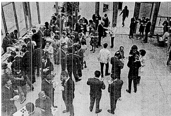
Fogadás az Országos Műemlékvédelmi Felügyelőség épületében a harmadik ICOMOS közgyűléskor Budapesten 1972-ben

E számos nagy jelentőségű megálapodás és hosszú távú együttműködés megszületése mellett a magyar műemlékvédelem 1970-es évekbeli legkiemelkedőbb nemzetközi eseménye az 1972. június 23. és 30. között Budapesten megrendezésre kerülő harmadik ICOMOS-közgyűlés volt. Az eseményre har-