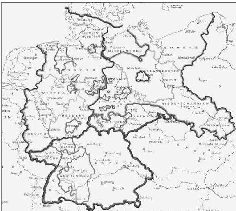
1. térkép.

külgyminiszteri értekezleten érte el csúcspontját, amihez Cordell Hull amerikai külgyminiszter passzívan asszisztált. Churchill földközi-tengeri–balkáni stratégiája 1943 végére szétesett, de az OVERLORD tervezésében az angolok kezdetről vezető szerepet játszottak, ami ezúttal a fő csapásirányban újította fel az angol–amerikai stratégiai vitát. 1943 nyarától az Egyesült Államok fokozatosan átvette a vezetést a nyugati stratégia meghatározásában. Teheránban Churchill a „junior partner” szerepében találta magát. Roosevelt és környezete bizalmatlansága egyre erősödött a „brit birodalmi” célokkal szemben. Az elnök el akarta kerülni, hogy az amerikai erőt a „junior partner” érdekében használják fel.