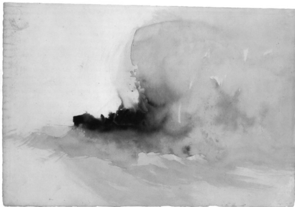
4. kép. William Turner: Égő hajó (?) (1826–1830 körül) 20