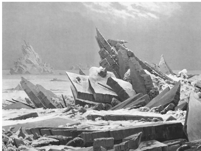
2. kép. Caspar David Friedrich: Jeges tenger (1823–1824) 13