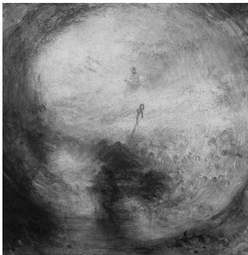
6. kép. William Turner: Fény és szín (Goethe tana) – az Özönvíz utáni reggel – Mózes a teremtés könyvét írja (1843) 27

alakokból egyaránt fakadhat. Turner mintha kihúzná a szemlélő lába alól a talajt: olyan pozícióból tekintünk a műre, mintha mi magunk is az örvénylő embertömeeggel együtt sodródnánk, és lábunk alatt nem lenne szilárd talaj. Végző soron a festő ezen a munkán is a mozgás, a fény és a színek hatásait helyezi előtérbe, ennek érdekében pedig elszakad a realiztikus ábrázolástól.