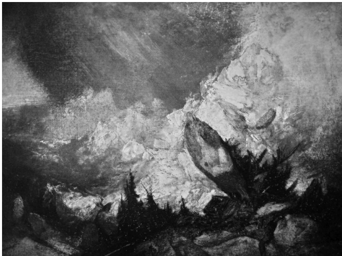
1. kép. William Turner: Lavina Graubündenben (A lavina romba dönt egy kunyhót) (1810) 12