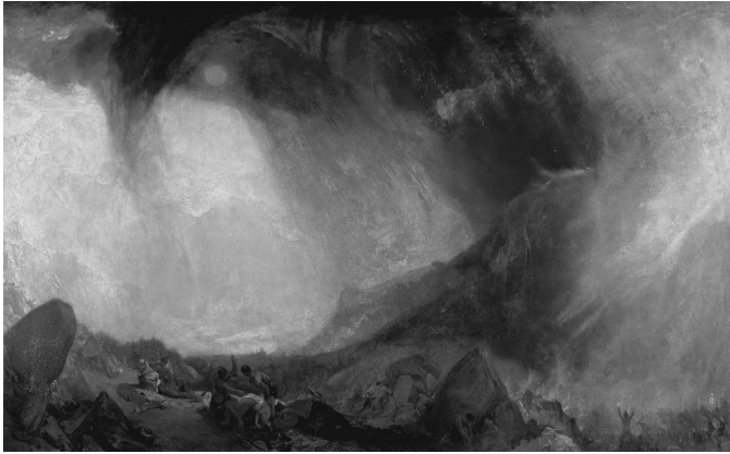
3. kép. William Turner: Hóvihar: Hannibál seregével átkel az Alpokon (1812) 19

vagy éppen katasztrófák. 1826 és 1830 körül készült Égő hajó (?) című akvarelljén első ránézésre csak festékfoltokat látunk; a hajó körvonalai feloldódva válnak eggyé a tűzzel, a füsttel, a lemenő nappal és a tengerrel – mindezt azonban inkább érezzük, mint látjuk. A pontos ábrázolás, vagyis a formák lehatárolása és a részletek aprólékos kidolgozása helyett Turner néhány jól elhelyezett festékfolttal utal a lángoló hajóra és annak környezetére. Ha a kép címét és az alkotót nem ismernénk, hihetnénk a művet egy modern, absztrakt alkotásnak is.