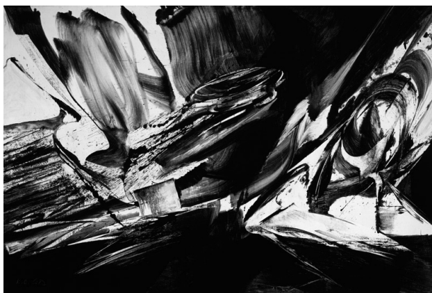
7. kép. Karl Otto Götz: Torden (1990) 30