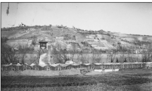
Az Öllerer család egykori virágkertészetének részlete 1961-ben