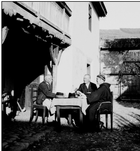
6. és 7. kép

férfi korát tekintve lehetséges, ám csupán arcvonásaikból nem lehetne biztos következtetést levonni. Van azonban még egy arc ezen a képen. A kép jobb oldalán látszik egy kislány, aki mezítláb, sötét színű ruhában lépeget, hóna alatt egy edényt, kezében egy víztől csepegő mosogatórongyot tart, valószínűleg megmosni viszi az edényt. Nyilvánvalóan nem állt a fotós szándékában, hogy őt is lefényképezze, ő csak véletlenül kerülhetett a kép szélére. A lány kíváncsian nézi az udvar közepén zajló fotózást, miközben lépeget a maga munkája felé, nem sejtve azt, hogy a képen ő is látszani fog. Ez a lány a gyűjtemény egy további fényképén is megjelenik, ami – úgy vélem – annak a jele, hogy közeli ismerőse lehetett P. Kassay Kelemennek, akár családtag is. Arcvonásai is hasonlítanak a két férfiéhez, bár nyilván ez önmagában nem bizonyítja a rokoni kapcsolatot.