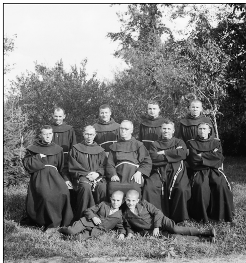
15. és 16. kép

Láthatjuk, hogy a fenti fényképek mind beállított felvételek, nem nagyon fotózták egymást valamilyen tevékenység közben, spontánul. Akárcsak a paraszti kultúrában, itt is a fényképezés többnyire valamilyen eseményhez kötődnek. Csak ritkán lehet azt sejteni, hogy maga a fényképezés az esemény, mint amilyen a munkaruhás idős férfival készült fotó. Egyetlen esetben tűnik spontánabbnak a felvétel: a 15. kép esetében lehet arra gyanakodni, hogy nem eleve azért ültek le arra a padra, hogy a fotót elkészítsék, hanem társalgás lehetett az összejövetelük elsődleges célja.