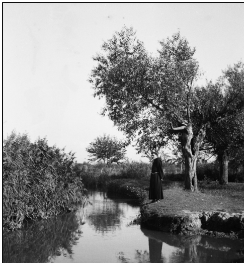
4. és 5. kép

A digitalizált változaton ez nem látszik, ám a fénykép negatívjának a fehér szélén a következő feljegyzés olvasható: „2 drb 13x13”. A megrendeléskor írhatták rá tollal, és azt jelenti, hogy két darab adott méretű kényképet rendeltek belőle. A fényképen azonban csak egy személy látszik. Azaz ha meg is tartott magának egy példányt, valakinek ajándékozott ebből a képből P. Kassay Kelemen. Ez az apró adat a fényképek hasznosítási gyakorlatára mutat rá: nem csupán maguknak készítik, hanem emlékül küldik, adják, ajándékozzák is azokat.