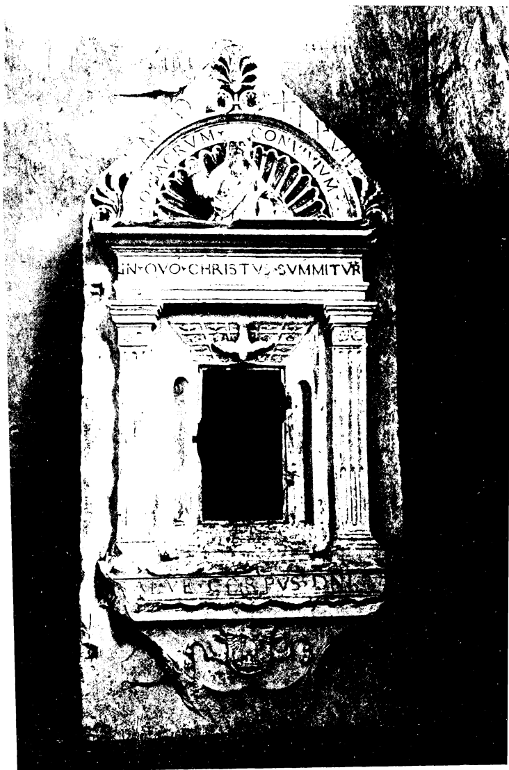
A kövesdi ref. templom pastophoriuma.