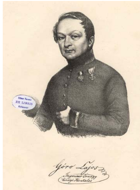
Goró Lajos portréja. Szathmári Pap Károly litográfiája, 1842

Mindezek megtalálhatók az országgyűlés jegyzőkönyvében, s beszámolt róluk a reformpárti ellenzék fóruma, a Méhes Sámuel szerkesztette Erdélyi Híradó is. E dokumentumokból és közlésekből egyébként az is kiderül, hogy a kezdeményezők és támogatók nagy bizakodással jószerint biztosra vették a múzeumalapítás megvalósulását.