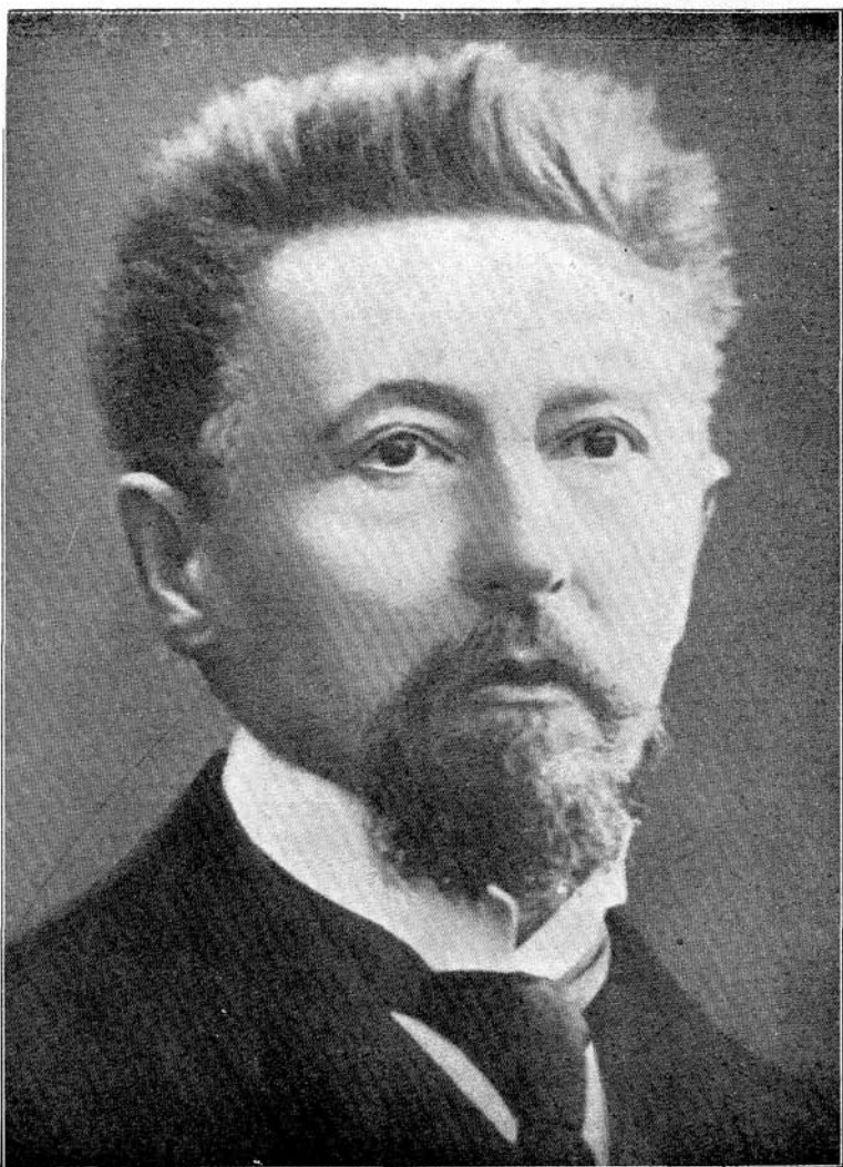
Szinnyei József (1857—1943)

Az Erdélyi Múzeumnak 1891—1893-ban szerkesztője volt.