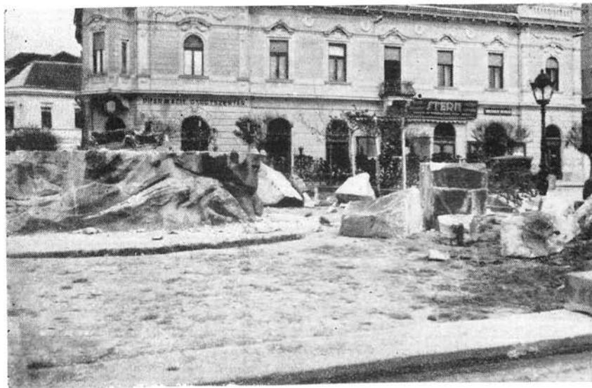
A szobor helye a rombolás éjjele után.