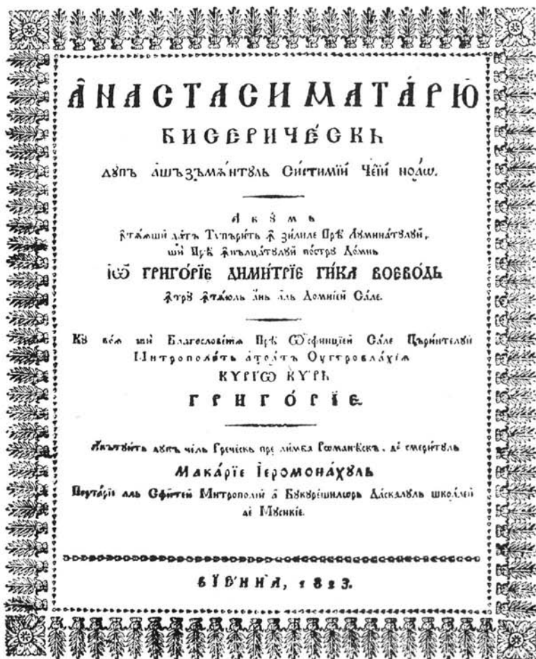
Macarie szerzetes templomi „Anastasiar”-jának címlapja. Bécs 1823.

egyházi zenét. A mozgalmat betetőzi Cuza fejedelem 1863. február 15-i törvénye, amely az egyházi gyakorlatban megtiltotta az idegennyelvű éneklést. Ettől kezdve a templomokban románul énekelnek. Az egyházi énekek szövegét görögből Macarie és Pann fordította románra. Ugyancsak