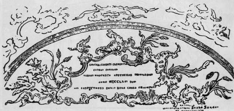
Falfreskó a főnöki szobájában.

A gyógyszerertár főnöki szobájában levő freskót Csikszentmártoni