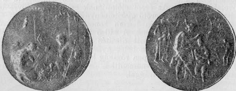
Budapest, Nemzeti Múzeum ólomlecsapat, 41 mm.

H) Krisztus keresztelése a Jordánban Keresztelő János által. Balra a háttérben két férfi, jobbra két ifjú foglal helyet, az utóbbiak egy fa mellett. Fent sugárkörben a Szentlélek, mint galamb. A fatöncön, melyen Krisztus térdel, CO monogramm.