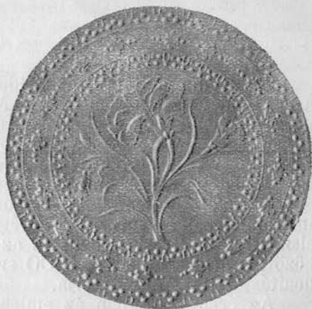
Stempelsammlung II. 881. sz. (előlap).

Az érmen semmi felirat, még mesterjelzés sincs. A csupán növényi és ornamentális elemekből álló térkitöltést érthetővé teszi a mohamedán vallás minden figurális ábrázolást tiltó rendelkezése.