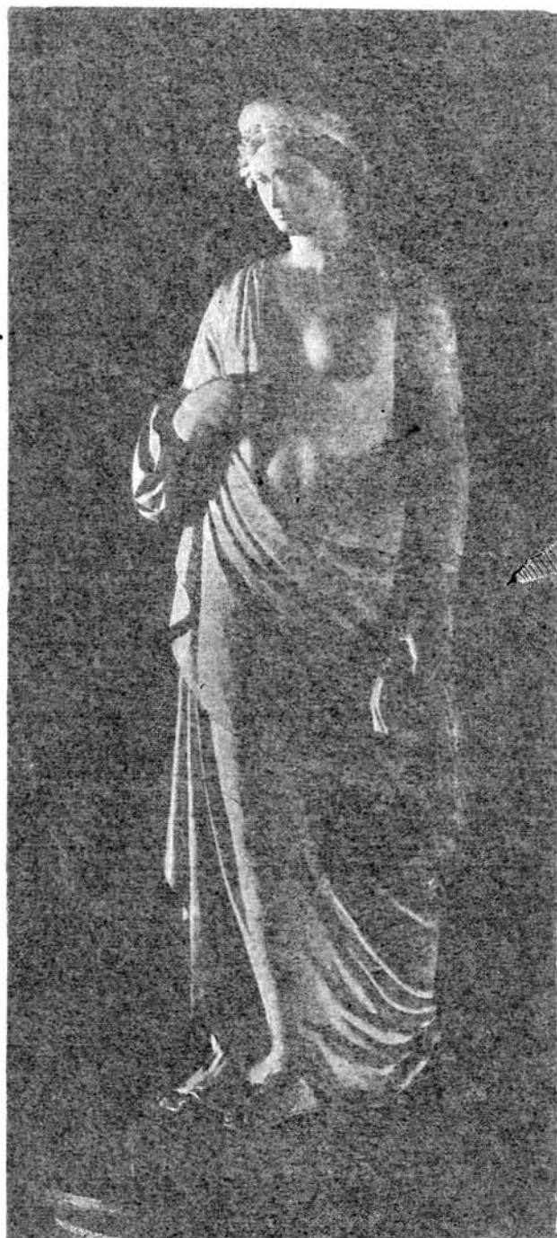
Zürlich Rudolf Juno-ja.