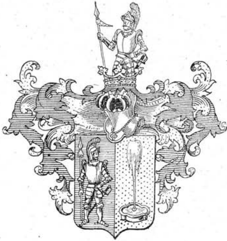
A Züllich-család czimere.