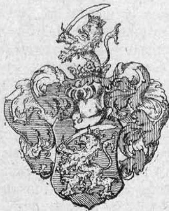
Barakonyi Ferencz czimere.

A dadogó és vitézkedő, vagyont szerző köznemes gyöngeségét a kedves lírikus talentuma fogja elfeledtetni.