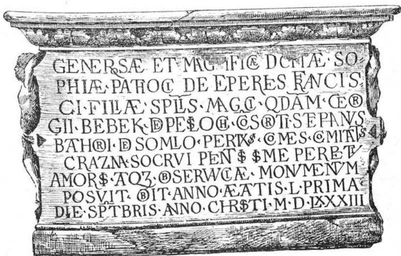
PATHÓCSY ZSÓFIA SARKOPHAGJA FELÍRATA. (Nemes Ödön rajza után.)

A sarkophág másik végén a következő felirat látható: