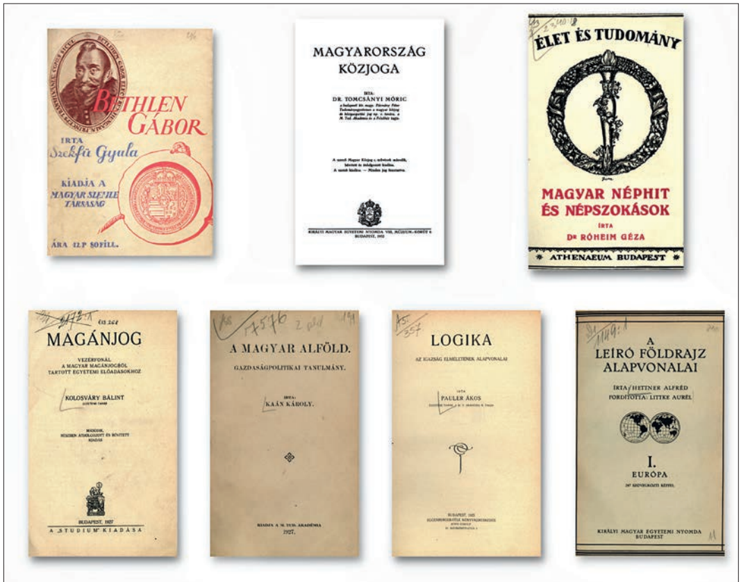
4. kép. A tudományterületek széles körét lefedő művek az 1920-as, 30-as évekből (montázs, borítók).

A törvénynek köszönhetően a hazai szakirodalom tekintetében a kötelezpéldány lett a Ház könyvtárának legfontosabb gyarapodási forrása, amely jelentős mértékben hozzájárult ahhoz is, hogy a könyvtár állománya 1919 és 1939 között megkétszereződött és 1939-ben már meghaladta a 180 ezer kötetet. A kötelezpéldányként érkező kötetek száma 1922 és 1939 között több mint 40 ezer volt, ami az összes gyarapodásnak közel felét jelentette. A törvény a gyűjtőkör kiszélesítése mellett hozzásegítette a könyvtárat ahhoz, hogy