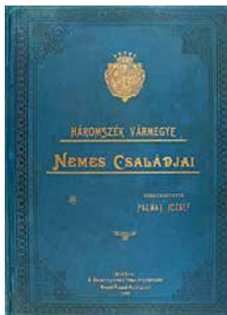
Háromszék vármegyei genealógiai mű (1901)