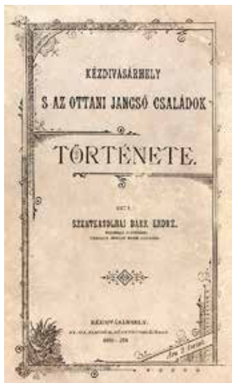
Kézdivásárhelyi helytörténeti munka (1896)

Turóczi István nyomdája 1892-től működött, és 41 kiadványát ismerjük az 1904 és 1919 közötti másfél évtizedből. Ugyancsak 1892-től jegyezték ifj. Jancsó Mózes nyomdáját, melynek 15 kiadványáról van tudomásunk az 1894 és 1903 közötti szűk évtizedből. Az üzembről 1906-ig rendelkezünk adatokkal.