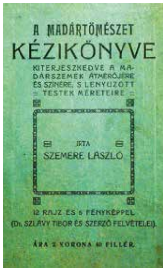
Ornitológiai mű Csíkszeredáról (1913)