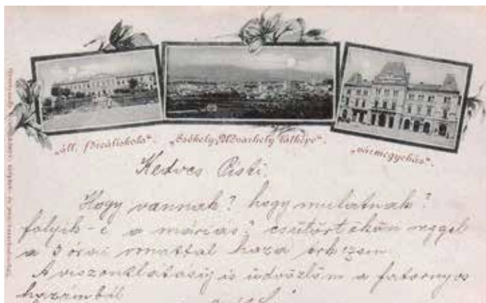
Székelyudvarhelyi képeslap (1902)