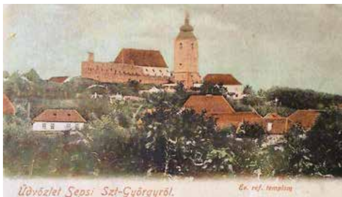
Sepsiszentgyörgyi képeslap a református templommal (1900 körül)

A helyi, 1882 óta működő Jókai Nyomda Rt. nem kevesebb, mint 106 kiadványát ismerjük az 1884 és 1918 közé eső bő három évtizedből. Ezek közül a legtöbb helyi iskolai értesítő. Emellett érdekes vonás, hogy a szerzők között számos latin eredetű álnéven publikáló akad.