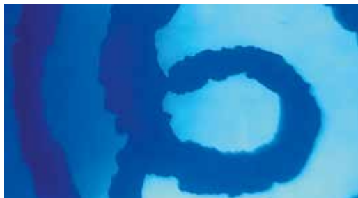
Arany prégelt bélyegrajzrészlet 90-szeres nagyítása

Ezzel a beállítással sikerült optimalizálni az aranyozást. A finom vonalak is jól látszódtak (80 \mu\text{m} -es), és a vastag részeken is volt rendes (400 \mu\text{m} -es) fedettség.