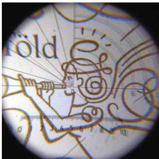
Aranyfestékkel nyomtatott bélyeg 10-szeres nagyítása