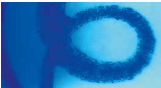
Arany nyomott bélyegrajzrészlet 100-szoros nagyítása