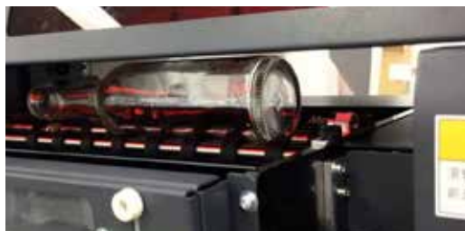
Az UJF-3042 „KEBAB” kiegészítője, hengeres tárgyak nyomtatásához

Egyre nagyobb igény mutatkozik a kis sorozatú és egyedi gyártások iránt, a nyomdák számára ez új kihívásokat és lehetőségeket is jelent.