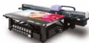
Mimaki JFX200-2513 A Mimaki síkágys UV-LED nyomtatócsaládjának újgenerációs kiadása 2,5 x 1,3 m-es nyomtatási felülettel