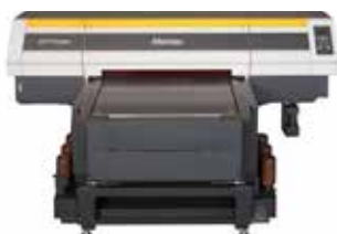
Mimaki UJF-7151plus Legújabb generációs asztali síkágys UV-nyomtató sík felületű tárgyak közvetlen nyomtatására