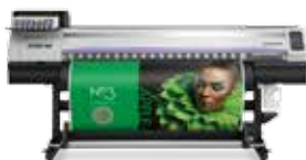
Mimaki JV300-160 Új, sokoldalú, magas minőségű és nagy termelékenységű oldószeres nyomtató