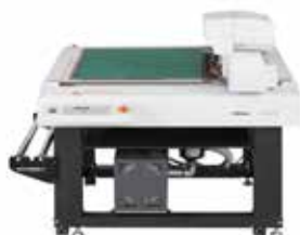
Mimaki CFL-605RT Kompakt, síkágys vágóplotter 610 x 510 mm vágási felülettel