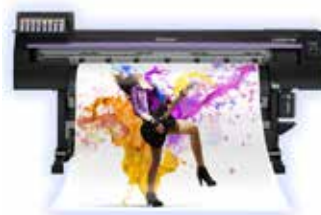
Mimaki CJV300-160 A legújabb fejlesztésű, nagy sebességű, 160 cm szélességű nyomtató-vágógép