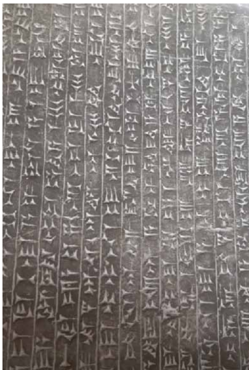
7. ábra. A kapuőr üzenete

látható. Végezetül nézzük meg az emberfejű szárnyas oroslánokat (6. ábra).