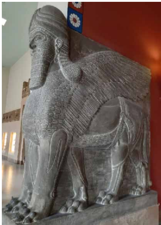
6. ábra. Az emberfejű szárnyas oroslán, az ókori városok kapuőre