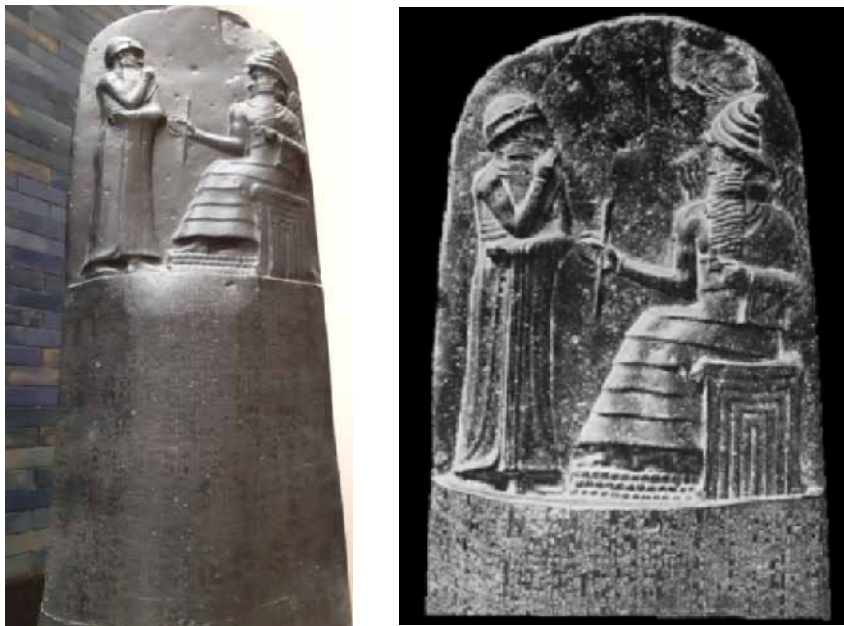
4. ábra. Hammurápi törvényei

részeit lefordította és az imént említett, nehezen olvasható írást megfejtette.