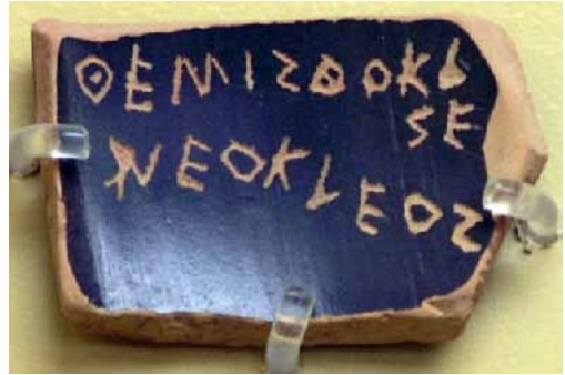
1. ábra. Szavazócserép

Ha valaki korábban visszatért, arra halálbüntetés várt.