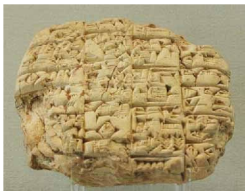
2. ábra. Ékírásos agyagtábla

Az agyagtáblák használata a Földközi-tenger medencéjében is terjedt.