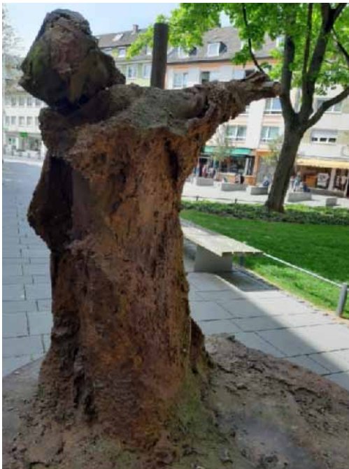
8. ábra. Gutenberg modern szobra a Szent Kristóf templom romja mellett. Születése után abban a templomban keresztelték meg.