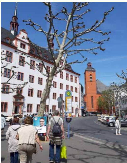
6. ábra. A Gutenberg Egyetem Mainzban. Az egyetem helyén állt az a templom, ahol 1468-ban Gutenberget eltemették. A templom később leégett, így épülhetett fel a helyén a könyvnyomtatás feltalálójáról elnevezett egyetem.