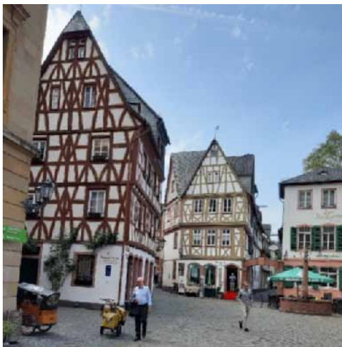
5. ábra. A város középkori hangulatát felidéző favázás házak