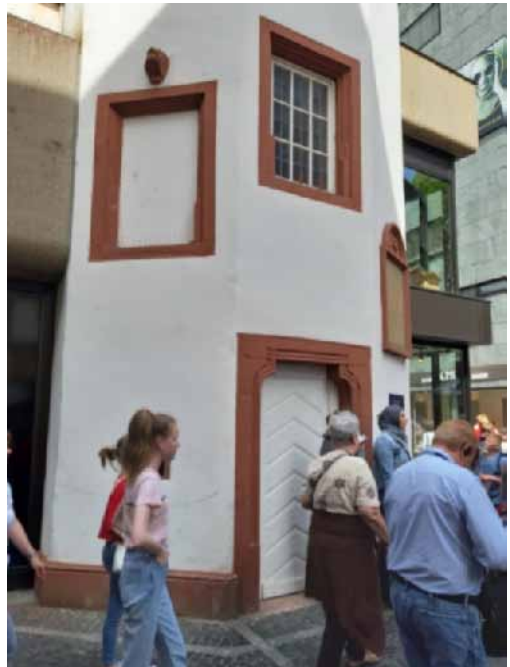
10. ábra. Ezen a helyen állt Gutenberg első nyomdája