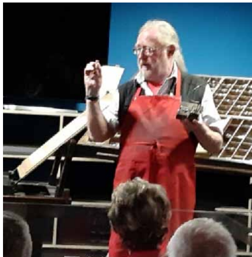
3. ábra. A Gutenberg Múzeumban gyakorlati bemutatókon ismerhetik meg a látogatók a betűöntés, a szedés és a könyvnyomtatás feltételeit