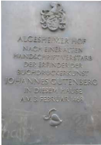
7. ábra. Az Algesheimer-ház emléktáblája. Itt volt utolsó lakhelye. Itt hunyt el 1468-ban.