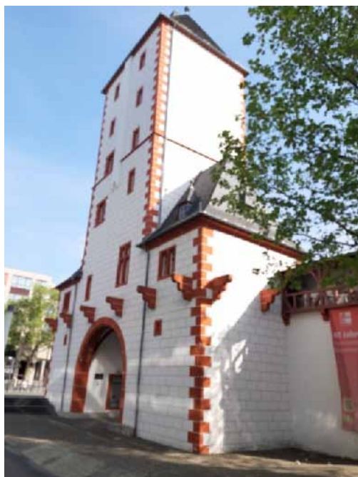
4. ábra. Mainz régi, rekonstruált városkapuinak egyike