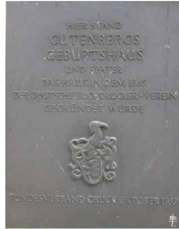
9. ábra. Gutenberg szülőházának emléktáblája. Később itt alakult meg a németországi könyvnyomtatók egyesülete.