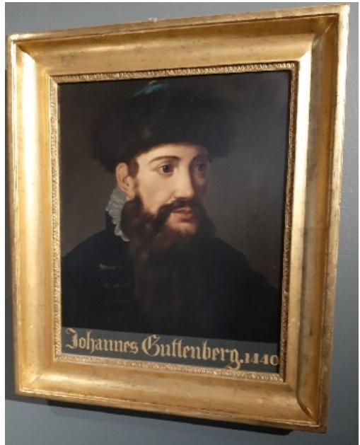
2. ábra. Gutenberg arcképe a múzeumban