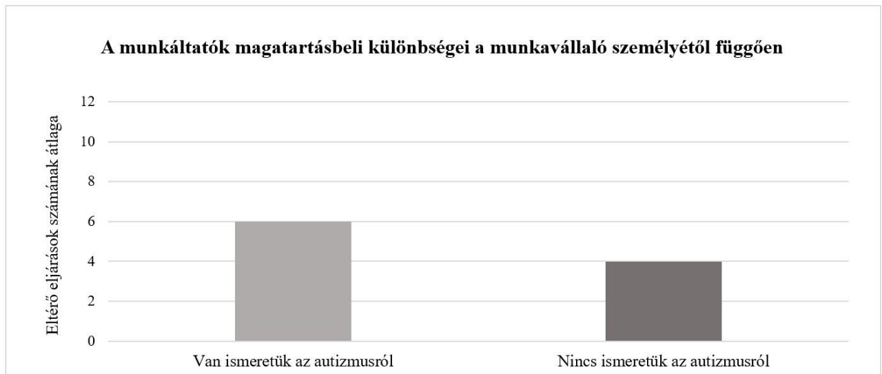
3. ábra, A munkáltatók magatartásbeli különbségei a munkavállaló személyétől függően

Az 3. ábrán összefoglalt eltérő eljárások számának átlaga megmutatja, hogy az egy kategóriába eső munkaadók átlagosan hányszor változtatták meg a magatartásukat attól függően, hogy a neurotipikus vagy autista munkavállaló szerepelt a szituációban. Azok a munkaadók, akik tisztában vannak az autizmus spektrum zavar főbb viselkedésjegyeivel, a 12 szituációból átlagosan 6-szor viselkedtek különbözően autista és a neurotipikus személlyel. Akik nem ismerik részleteibe menően az állapotot, átlagosan 4-szer reagáltak különbözően az azonos szituációkban. Az autizmusról információkkal rendelkező adatközlők valamivel nagyobb arányban változtatnak a problémamegoldási stratégiáikon a munkavállaló kommunikációs partner személyétől függően.