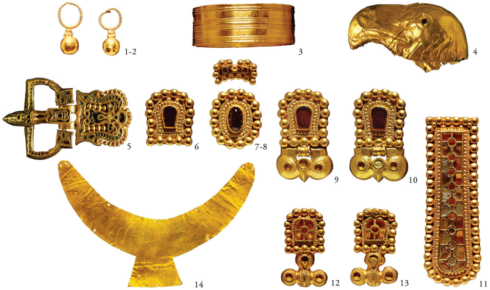
4. kép. A kunbábonyi avar előkelő (kagán?) arany ékszerei és viseleti tárgyai. 1–2. fülbevalók; 3. karkötő; 4. jogar vagy lovaglopálca fejét díszítő sasfej; 5–13. álcasatos öv; 14. félhold alakú mellűz (Tóth–Horváth, 1992)