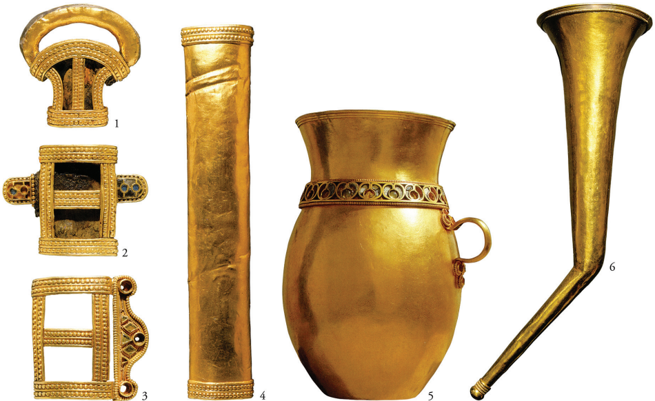
5. kép. A kunbábonyi avar előkelő (kagán?) arany személyes tárgyai. 1–4. kard veretei; 5. másfél kilós arany korsó; 6. ivókürt (Tóth–Horváth, 1992)