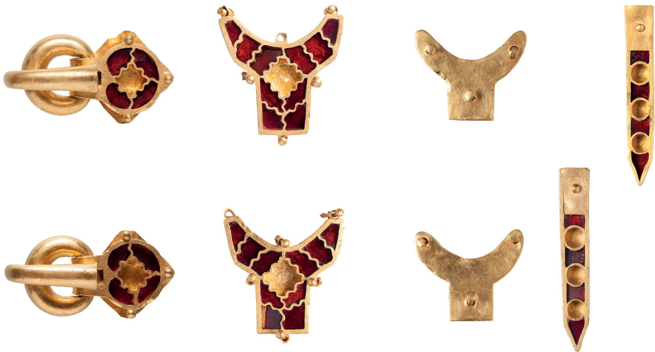
2. kép. Lábbelihez tartozó aranyveretek a Telki mellett feltárt áldozati leletegyüttesből (Szenthe et al., 2019)

személyes tárgyakból (arany ruhadíszek, övveretek, lábbeli garnitúrák), fegyverekből, lószerszámdíszekből, edényekből álló leletegyüttesek. Sztjeppei párhuzamaik (kurgánokhoz kapcsolódó lelőhelyek) és a debreceni sírlelet alapján tudjuk őket a temetkezési rituáléhoz kötni. A legtöbb Kárpát-medencei esetben ugyanis nem ismerjük magát a sírt, csupán az utólag – feltehetően a sír közelében – elásott áldozati együttest. A híres Szeged-nagyszéksósi lelet mellett ilyenek kerültek elő Pécs-Üszög, Bátaszék, Pannonhalma és Telki határában is. Ugyanakkor a debreceni lelőhelyen egy késő szarmata sírt körülvevő árokba ásva került elő egy nemesfém- és vastárgyakból álló áldozati lelet. Ebben az esetben tehát egy jól ismert szarmata temetkezési rítushoz kapcsolódik az új, sztjeppei rítuselem, ami a helyi, késő szarmata és a hun-alán elit közti szoros kapcsolatokra utal (Wieszner–Nagy, n. d.). A másik, újonnan felfedezett áldozati együttes a Pest megyei Telkiből már a hun korszak végén kerülhetett földre, valószínűleg a hun uralom felbomlását követően. Ez a lelet arra világít rá, hogy bizonyos körökben még a birodalom szétesése után is fennmaradhatott ez a sajátos, a hun kori előkelő réteg önkifejezését és összetartozását tükröző gyakorlat (Szenthe et al., 2019) (2. kép).