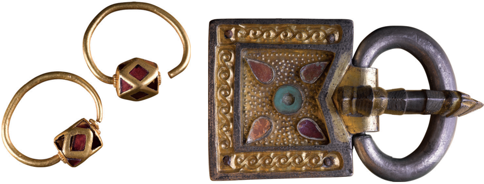
3. kép. Hun kori női sír fülbevaló- és csatlelete Kapolcsról