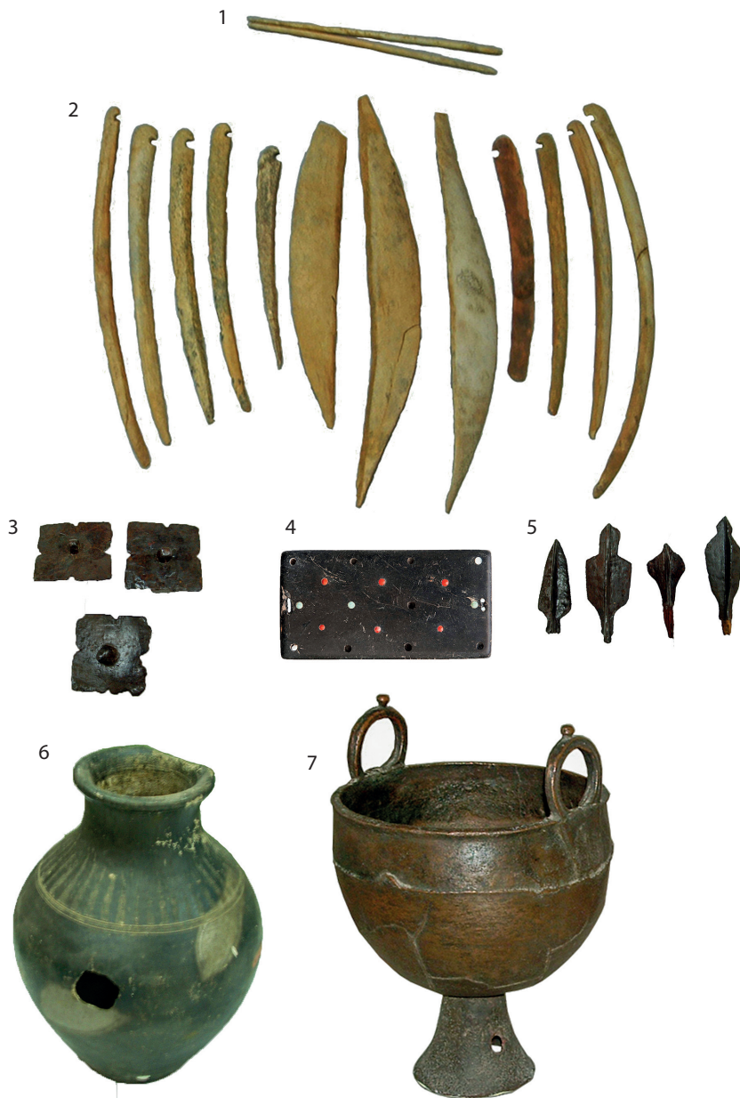
6. kép. A kőkörös sírok jellemző leletanyaga a Mongol Tudományos Akadémia Régészeti Intézetének leletanyaga alapján: