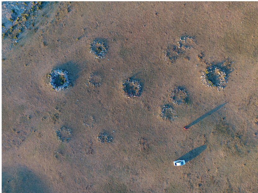
3. kép. Hsziungnu kőkörös sírok madártávlatból (Galtin Am lelőhely, Zaamar járás, Mongólia) (A. D. Jambajantsan drónos légi felvétele, 2018. június 17.)