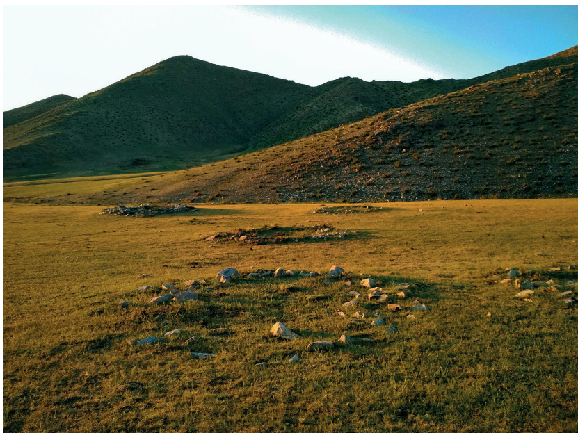
4. kép. Kőkörös sírok Galtin Am lelőhelyen, Zaamar járás, Mongólia (a szerző saját felvétele, 2018. június 17.)