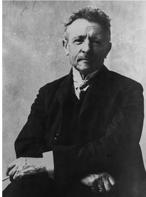
Lóczy Lajos, a Magyar Királyi Földtani Intézet igazgatója 1918 körül

A változatos életút legfontosabb állomásai között tallózva, az ismétlés vádját kockáztatva (egy, egyébként fontos elemeket helyhiány miatt nem részletezve) emeljük ki ehelyütt azokat a momentumokat, amelyeknek korunk jelenlegi és jövőndő magyar geológusai/geográfusai (s a tevékenységüket meghatározó tudománypolitikai környezet) számára is üzenete lehet.