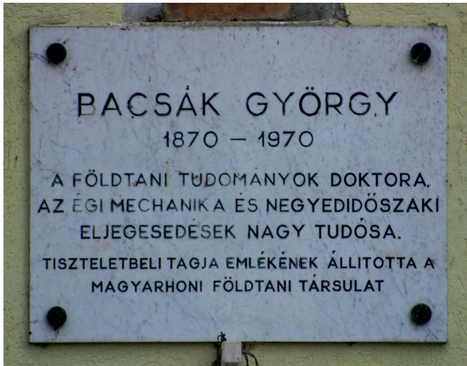
2. ábra. Emlékezés Bacsák Györgyre Fonyód városban

Bacsák Györgyre nagy tisztelettel emlékezik a Magyarhoni Földtani Társulat és a Magyar Földrajzi Társulat is. E két szervezet emléktáblát helyezett el a tudós fonyódi házában (2. ábra). A Magyar Tudományos Akadémia Földtudományi Osztálya 1997-ben emlékülést tartott a tiszteletére.