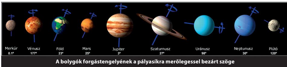
1. ábra. A Naprendszer bolygóinak tengelyferdesége