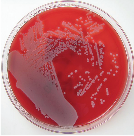
3. ábra. Staphylococcus aureus baktériumtenyészet