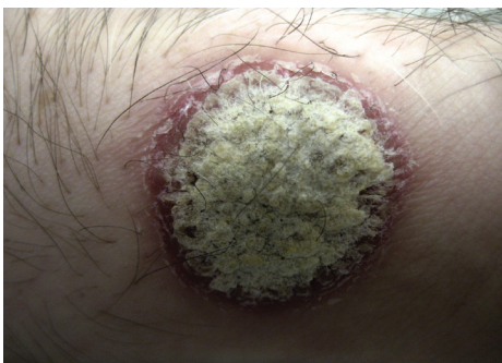
1. ábra. Pikkelysömörös plakk

A mikrobiológiai megközelítés ezzel szemben egészen új keletűnek számít. A teljes emberi génállomány feltérképezését célzó Humán Genom Projekt mintájára Humán Mikrobiom Projektnek (HMP) nevezik azt a kezdeményezést, amely a testünk különböző részein megtelepedő mikrobák vizsgálatát tűzte ki célul. A bőr mikrobiomjának vizsgálata viszonylag későn, 2009-ben kezdődött el, addigra már elemezték a tápcsatorna és a női reproduktív rendszer flóráját is. A bőrön élő mikrobák vizsgálatához tíz egészséges önkéntest vontak be. Az önkéntesektől körülbelül húsz különböző helyről vettek mintákat, fontos szempont volt, hogy vizsgálati anyagok egyaránt származzanak a viszonylag zsírosabb, illetve a szárazabb bőrterületekről is.