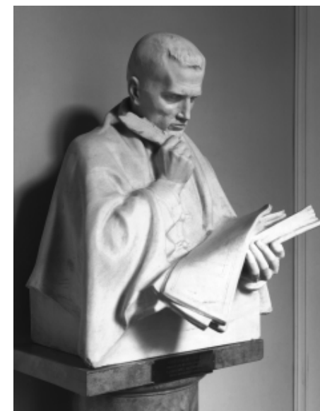
Holló Barnabás: Kőrösi Csoma Sándor, 1909

Stein Aurél Lahorba érkezése után ismerkedett meg Lockwood Kiplinggel (1837–1911)