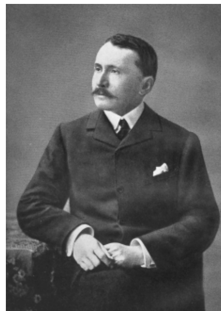
Stein Aurél (1862–1943)

Kőrösi Csoma első életrajzíróját, Duka Tivadart, Stein Aurél atyai barátai között tarthatta számon. Amikor tübingeni doktorátusát követően magyar állami ösztöndíjak segítségével kutatásokat folytatott Londonban, Oxfordban és Cambridge-ben, nagybátyja, az akadémikus Hirschler Ignác aján-