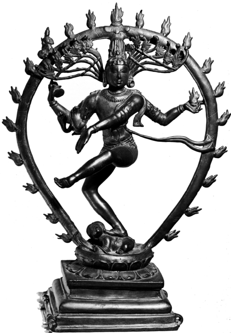
4. kép • Síva egy törpe démon testén táncol. Az őt övező fénykoszorú a dicsőségét hirdeti, de egyben a pusztítás és újjászületés ciklusát is jelképezi. Kezében két koponyatetőből készített csörgődob. Bronz, x. sz., Madrasz.