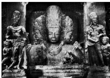
3. kép • Trimurti, Síva háromarcú ábrázolása

„szépnek tartható” mű a londoni Viktória és Albert Múzeumban megcsodálható.