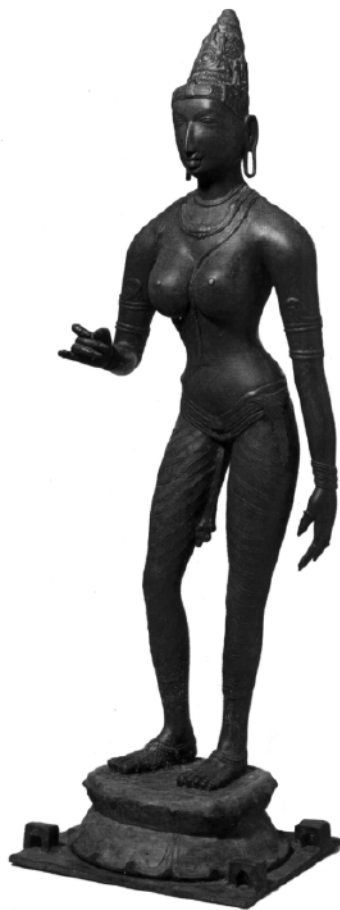
2. kép • Parvati királynő, Síva felesége. A világ egyik legszebb női szobra, Csóla-kori bronz.

J • Síva, a Jóga lordja lótoszon ülve meditál. Az arc vonásaiból érezhető Síva bölcs nyugalma és spirituális ereje. Bizonyított, hogy szigorú aszkézissel önismerethez és megvilágosodáshoz lehet jutni. Mellékalakként jelenik meg Brahmá és Indra az őket szállító