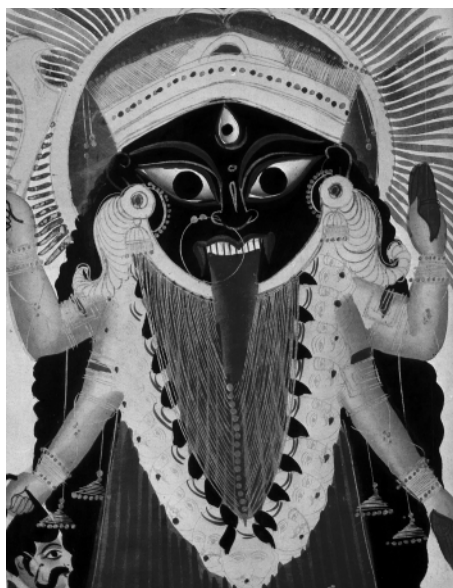
5. kép • Káli, a fekete földanya koponyafüzért visel, jobb kezében egy levágott, vérző fejet tart.

mellett romboló, pusztító jellege is van, úgy a hozzájuk tartozó attribútumnak, a koponyának is lehet kettős értelmezése. A hinduizmusban a koponya nemcsak a halált, hanem a létezés egységével az újraszületést is jelenti. A létkörforgás biztosítja, hogy a halál nem jelenti a létezés végét, miáltal a koponyának nemcsak negatív, hanem pozitív aspektusa is lehetséges, a pusztítás megelőzi, és helyet ad a teremtésnek. A démonok ellen harcba induló istenség az ellenség megfélemlítésére koponyával ékesített fejdísz, nyakában koponyafüzért hord. Ugyanakkor békés családi körülmények között kellemes közös időöltésül szolgálhat a füzér készítése koponyákból (lásd a Siva és családja festményt).