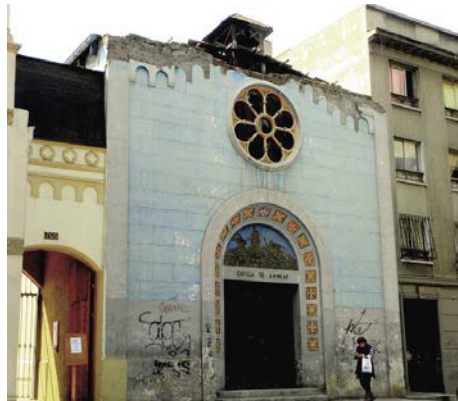
Ez a kápolna is a két és fél évvel ezelőtti rengésben sérült meg

Ekkor összeszedtem minden bátorságomat, és óvatosan kimentem az erkélyre. Emlékeztem rá, hogy a minap a lakótársam mesélte, a 2010-es rengéskor a nővére is a 16. emeleten volt, és mikor kinézett, azt látta, az emeletes házak annyira kilengtek, hogy eltűntek egymás mögött. Én is valami hasonlót szerettem volna látni. Sajnos vagy szerencsére ez nem jött össze, és ez megnyugtató, hogy nem újabb szuperföldrengés van a láthatáron.