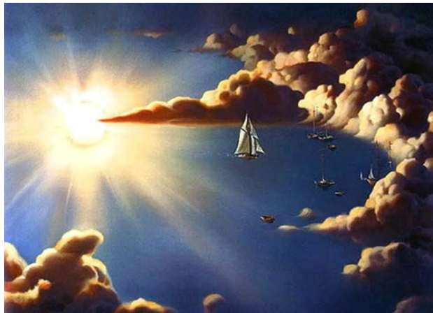
Hajócskánk változatlanul a fény irányába halad... (Salvador Dalí: Hajók őrizetben)

- Az új év első napja az ígéretek, fogadkozások napja. Valamennyire érthető, hiszen újból elkezdődik valami. S hogy mi, az csak tőlünk függ. Ha akarjuk, másképpen lesz minden, ha akarjuk, minden marad a régiben. A döntés szabadságát maga a lehetőség teremti meg: változtathatunk, ha akarunk. De ne essünk bele a sokak által elkövetett hibába: vannak, akik sokat várnak az új évtől, de meglepően keveset önmaguktól.