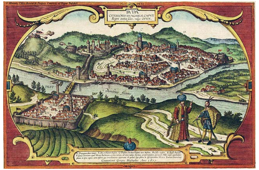
Buda és Pest látképe a 16. században (Georg Hoefnagel metszete alapján)

Más forma volt a lesvetés , lesre csalás. A módszer hasonló volt itt is a rajtaütéshez. A martalék itt már nagyobb létszámot számlált. Általában 25-30 fő lovas elnyargalt a törökök által lakott vár előtt, többnyire akkor, amikor azok lovakat fűveltek a vár előtt. A lovakat őrzőket menetből levágták, a lovakat pedig elhajtották. Ekkora szemtelenség láttán a török szpáhik rögtön