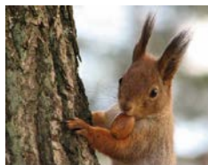
A mókussal együtt B.U.É.K. az AMH!

Ezért fohászokunk, ezért ver a szívünk, Adjon az Úr Isten Boldog Újesztendőt nekünk!