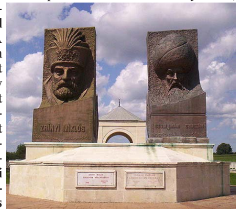
Zrínyi Miklós és I. Szulejmán szobra Szigetváron, a Magyar-Török Barátság Parkban