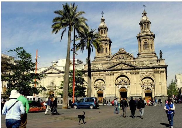
A katedrális homlokzatán 2010-ben megsérült középső Szűz Mária-szobor ma az oltár mellett van kiállítva

Érkezésem után egy nappal, a santiagoói városnéző túrán mesélt idegenvezetőnk Chile legutóbbi, 2010. február 27-én bekövetkezett hatalmas földrengéséről. A 8,8-as mozgás volt minden idők 6. legnagyobb feljegyzett földrengése. Három percig tartott, és sokan azt gondolták, itt a világ vége. Érdekes tény, hogy míg az ugyancsak 2010-es haiti földrengésnek becslések szerint több mint 200 ezer áldozata volt, addig az annál 500-szor erősebb chileinek összesen nyolcszáz. A károk így is kitétek Chile GDP-jének közel ötödét, és több ezren váltak hajléktalanná. A helyreállítás még most is zajlik, de Santiagóban már szinte alig látni ebből valamit. Így én is úgy hallgattam a történetet, mint a chilei történelem egy fájdalmas bekezdését. Arra nem gondoltam, hogy hamarosan részese leszek ennek a véget nem érő történetnek.