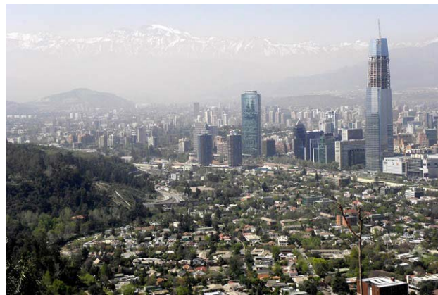
A kép jobb szélén látható épület Latin-Amerikában a legmagasabb - háttérben a Cordillera a szmog mögött

A chileiek nem félnek a földrengéstől. Megszokták - az életük része. Ezt a gyermekvállaláshoz hasonlítják: ez a világ legtermészetesebb dolga, ugyanakkor, amíg valaki nem éli át, nem lehet rá felkészülni. Mindennél jobban mutatja a chileiek magabiztosságát a tény, hogy Santiagóban épül Latin-Amerika legmagasabb épülete, a Gran Torre Santiago, amely ha elkészül, pontosan 300 méter magas lesz.