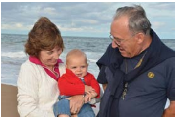
Marcika a büszke nagyszülőkkel