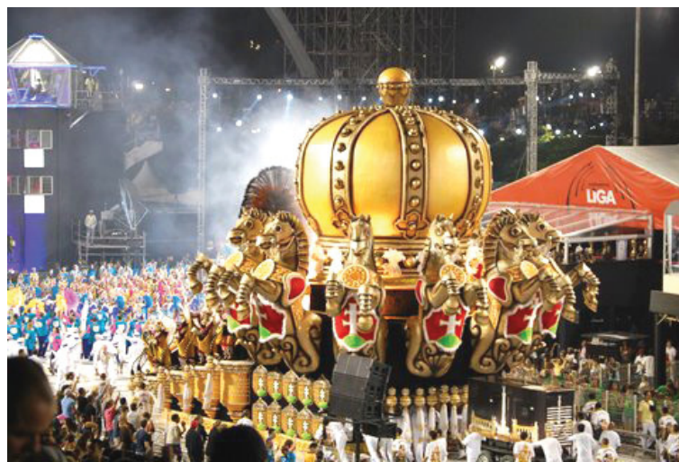
A magyar korona