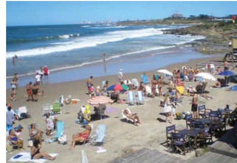
Az Punta del Este-i idillikus Playa Mansa

- Uruguayban, Punta del Estén, ezelőtt 35 évvel 7.000 dollárért vettünk egy 2 szobás (50 m 2 ) kényelmes lakást az Arcobaleno fenyőerdővel körülvett telepén, a szelíd ( Playa Mansa ) part 16-18 számú megállójánál. Úgy éreztem magam