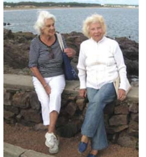
A két barátónő a szeles tengerpartot is élvezi...