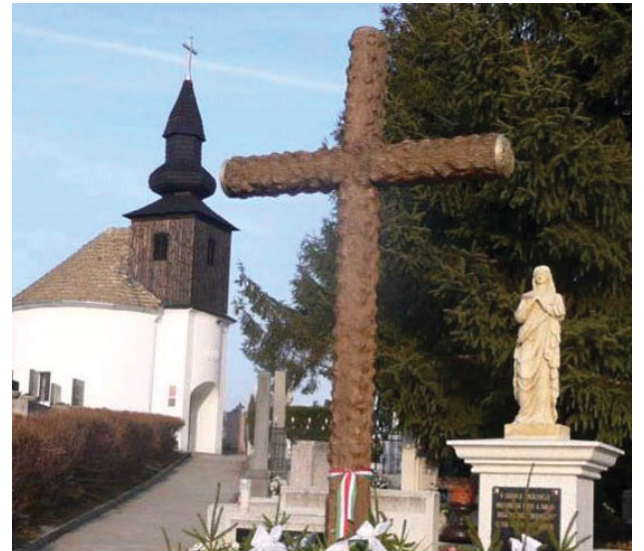
Húsvét Pakson: Kálvária temető