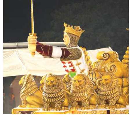
A hős magyar király kivonja a kardját...

„Magyarországot megtámadta a Batukán gonosz megszálló hadseregével,