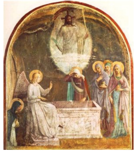
Harmadik nap hajnalán Jézus sírjához érkező asszonyokat két angyal várta: Miért keresitek Őt a holtak között? Feltámadt!

És amikor ez van, így van, a front teljesen átlátható és értelmezhető, hadd szólaljon meg a reménység. A Feltámadás Reménysége! Magyarágunk nem egynapos, nem egyhetes, hanem legalább ezeréves tudatos és áldozatkész természet! Erő! Mi műveltük Európa és a világ csodáját már azzal, hogy ellenséges gyűrűbe fogva meg tudtuk maradni! Mindez az erő, képesség génjeinkbe van táplálva. Szétszaggattak bennünket, szétziláltak, hatalmas erők dolgoztak azon, hogy el is butítsanak, kimossák a lelkünkben, agyunkból önnön mivoltunknak a jeleit. Ment ez egy ideig múltban és jelenben mindig, de közben közben fel-feltámadtunk újra és újra.