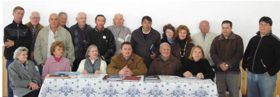
Comisión Directiva de Villa Ángela, Chaco