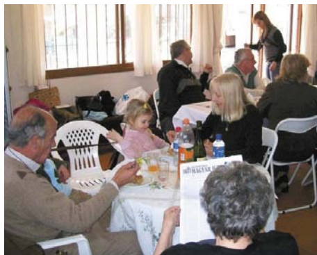
Círculo Húngaro de Córdoba

En ocasión de un pasado almuerzo en honor a la fiesta de San Esteban rey en el Círculo Húngaro de la Provincia de Córdoba , podemos ver que un comensal está leyendo el AMH... ¡Nos alegramos!