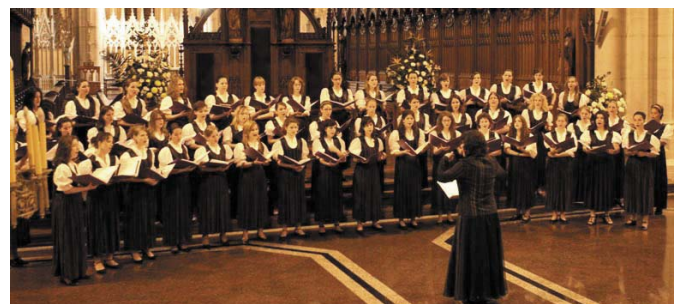
Az Angelica leánykórus egyik sikeres argentinai föllépésén Gfoto.org