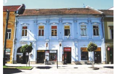
...és fogságának háza (Pulszky ház)

francia huszárság alapítója született. Megnézhetjük a Pulszky házat is, ahol Rákóczi Ferencet is őrizték néhány napig és ami Dembinszky hadiszállása volt 1848-ban. A Peda-