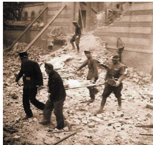
Az áldozatok elszállítása