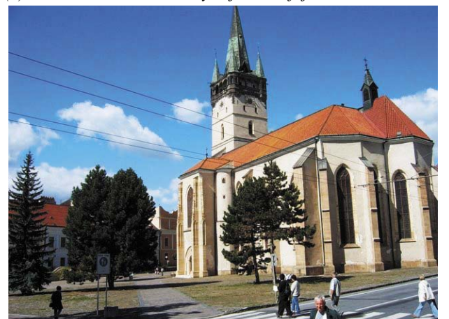
A híres eperjesi Szent Miklós templom

(*) Posztumusz közlés. Folytatjuk a befejező, 2. résszel.