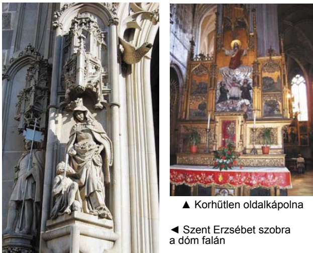
▲ Korhútlan oldalkápolna