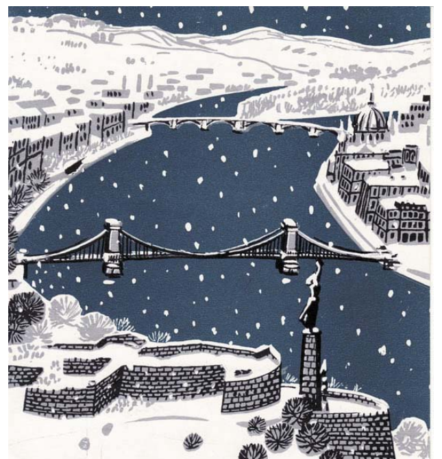
Szilvász Nándor rajza (köszönet Saary Éva)