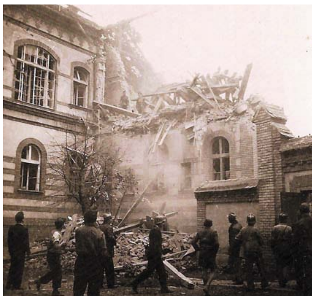
A bomba a sebészeti osztályon csap be