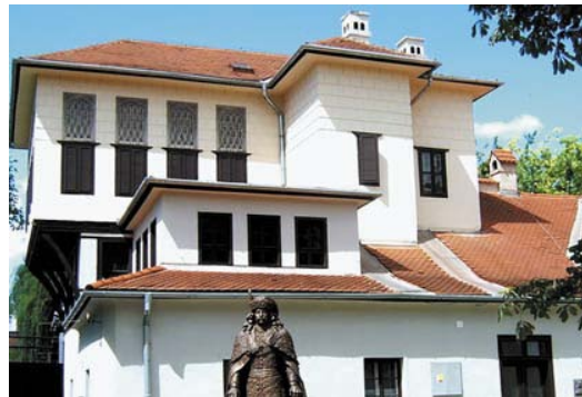
◀ A rodostói ház másolata