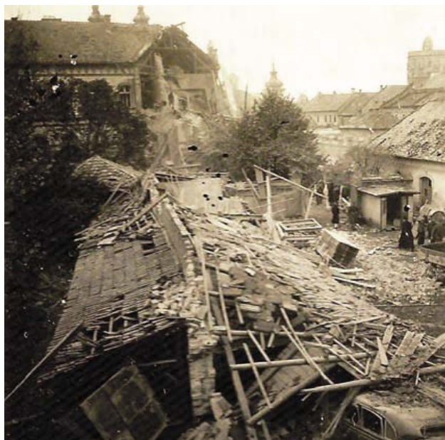
Az Irgalmas kórházat telitalálat éri