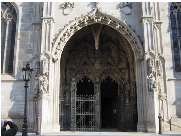
Szent Erzsébet dóm bejárata