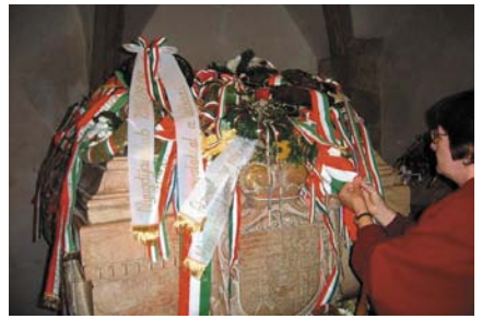
◀ A fejedelem babérkoszorúkkal elborított szarkofágja és ▲ temetési zászlaja

Kassa minden negyedéről szép levelezőlapokat árulnak, csak Rákóczi sírjáról nem, de még fényképezni sem szabad, fizetségért sem. Elgondolkoztató, hogy még 300 év múltán is féltékenynek kell lenni mindenre, ami magyar? Nem lehet megindulás nélkül ott lenni, csupán egy Miatyánkot csendesen elmormolni magunkban... magyarul.