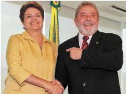
Lula leköszönő elnök erősen korteskedett kiválasztottja, Dilma érdekében

Ennek egyik oka, hogy nagyon ügyesen felnyomták a belső piacot, de még az is, hogy a brazil bankok nem vásárolgattak össze gyanús bankpapirokat... Egyszóval, Lula népszerűsége most, mandátuma végén, elérte a 80%-ot! Persze azt ezek a lelkes hívei nem veszik figyelembe, hogy egyrészt Brazília történetesen ásványi kincsekben (vasérc) de sok másban is (szőjabab, fa, cukornád, kukorica, narancslé, autó stb.) egy igen gazdag ország, annyit exportál mindenhová, amennyit csak akar. Másodszor pedig Lula elnök, nagyon bölcsen, az előző kormány, Fernando Henrique Cardoso kormányának, amely leállította az éveken át tartó inflációt (!), jó pénzügyi szakembereit nem cserélte le!