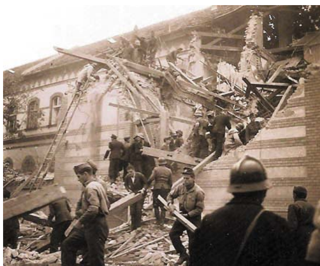
Azonnal kezdődik a mentőakció