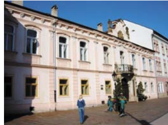
A püspöki palota

A püspöki rezidencia úgy látszik csak a szlovákoknak van nyitva, a sok régi nemesi palotának (Barkócz, Csáky, Forgách, Kátay) még a neve sem maradt meg, most múzeumok, közhivatalok, névtelenségbe