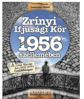
A gyönyörű kivitelezésű könyv méltó 56 szelleméhez