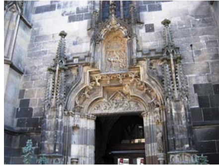
◀ Lejárát II. Rákóczi Ferenc kriptájához

ami nem is olyan egyszerű. A kriptá szigorúan lezárva, csak időnként jelenik meg a magyarul is beszélő vezető. A lejártnál kicsi tábla szlovákul, németül, angolul (!) és kisebb betűkkel magyarul is tájékoztat, ki álmodik ott lenni egy szép magyar hazáról. A boltozatos, hideg kriptában Rákóczi szarkofágját elborítják a babérkoszorúk, mindegyikről piros-fehér-zöld szalag csüng. Nem valószínű, hogy sok német lenne kíváncsi a sírboltra.