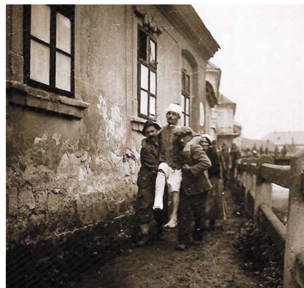
Túlélő is akadt...