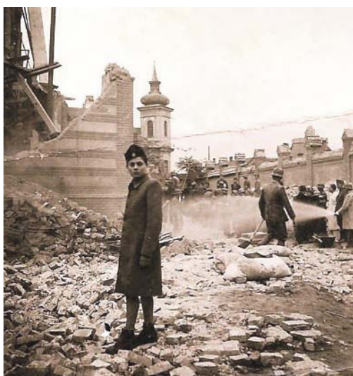
◀ Kutatás sebesültek, halottak után