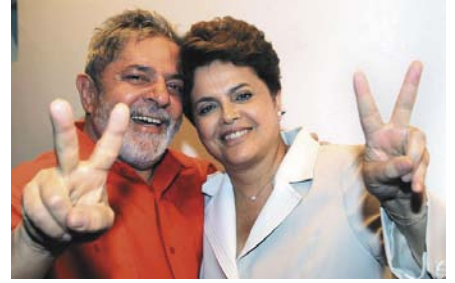
Lula, mint mentor, megtöltötte Dilma jelöltet önbizalommal