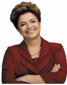
Dilma Rouseff, a 2. fordulónban 56,05%-kal megválasztott brazil elnökasszony, gondosan kifinomított imázssal

1979-ben általános amnesztiát kapnak az 1964-ben megkezdődött katonai diktatúra ellenfelei.