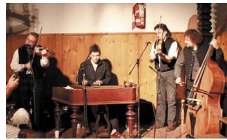
A kiváló élőzenekar meghatározta a hangulatkeletést!