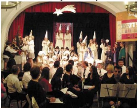
Összép az igen jól sikerült Betlehemesről

- Az idén mindkét várva várt eseményt egyszerre rendezték meg ezen a szombat estén a Hungáriában. Eleinte kicsit zavart a rengeteg visító, szaladgáló kisgyermek, de a végén boldogan élveztem az egész programot. A Zrínyi Kör diákjainak minden csoportja, minden korosztály szerephez jutott. A szerek pedig hagyományos magyar népi szokásokat mutattak be, a betlehemesek és pásztorok jelmezében.