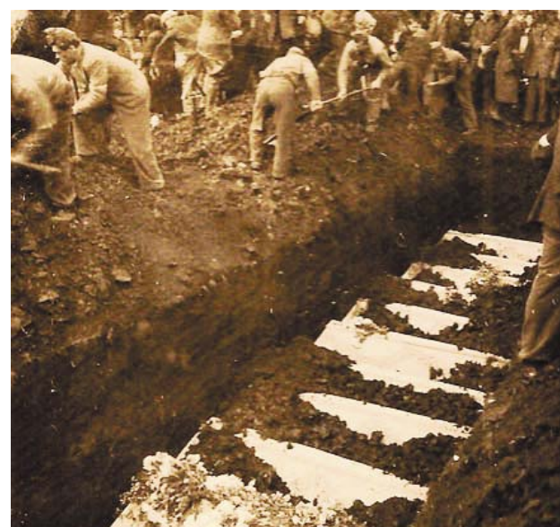
Az addig megtalált áldozatok tömegsírja