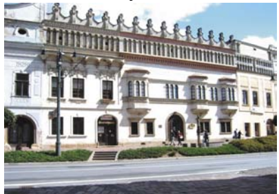
Az eperjesi Rákóczi ház...

gógiai Intézetet még Ferdinánd király építtette 1848-ban, amint a ma is meglévő magyar felirat hirdeti. Mivel a betűk homorúan vannak bevésve, nagyon nehezen lehetett volna csak eltávolítani. Egyszerűen átmeszelték, de azért még most is jól olvasható.