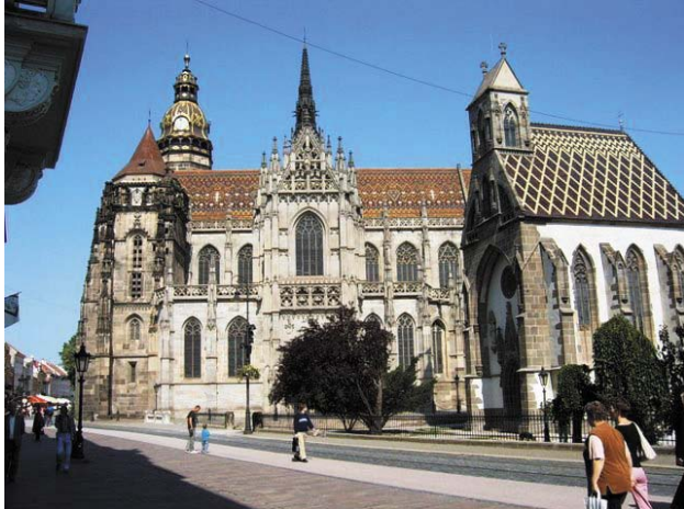
Szent Erzsébet dóm és Szent Mihály kápolna

Egész Magyarország legszebb gótikus templomát igyekeznek rendben tartani, kívül is, belül is impozáns.