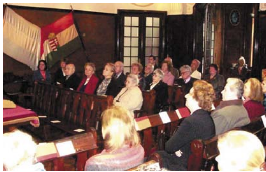
Telt ház a református templomban