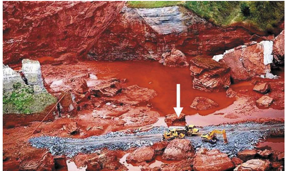
Ha megfigyeljük a képen a kamionok és kotródaruk nagyságát, fölmérhetjük az iszap szétterülésének elsöprő, fékezhetetlen kiterjedését

És a legfontosabb: a lúg. Értékesítésük szerint 12-13 pH-t mértek az áradatban, ami kb. 1%-os lúgkoncentrációnak felel meg. Ez folyósabbá teszi az iszapot, ami a nagy területen való szétterülést eredményezi. Ez a legjobb hatása. Rosszabb, hogy ez a kevésnek tűnő mennyiség szembe kerülve nagyon rövid idő alatt vakságot okoz, így ember és állat, ha a fején átsapott az ár, gyakorlatilag elveszett. Lenyelve, a száj és a nyelőcső felmaródását okozza. A gyomrot kevésbé