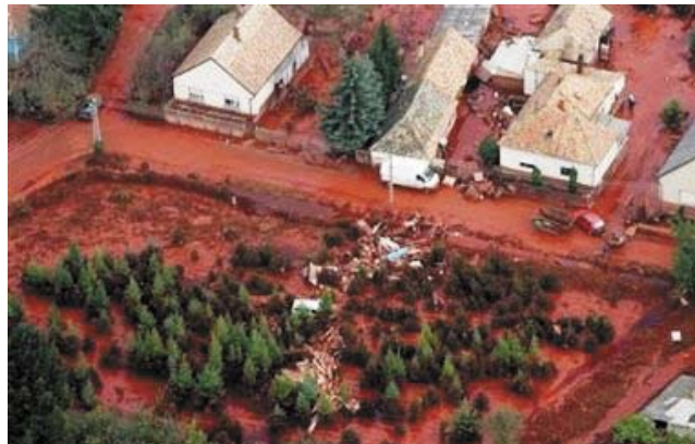
Föltarthatatlanul ömlik a vörös iszap. Itt Devecser, Budapesttől 164 km-re délnyugatra.

Október 4-én de. 10 órakor a Veszprém megyei Kolontár község fölött lévő, alumíniumgyártásból keletkező vörös iszap tározó gátja átszakadt, és az áradat másodpercek alatt lecsapott a gyanútlanul éldegélő falu lakóira. A lúgos tartalmú folyam embereket, állatokat, járműveket ragadott magával s épületeket döntött romba. Néhány percre rá a rohanó vörös veszedelem elérte Devecsert, és ott is hasonló pusztítást végzett. Így lehet röviden sommáznai a történeteket. A tragédia azonban az anyagi és emberi veszteségeken túl hatalmas környezeti és erkölcsi károkat is okozott. Nem véletlenül kerültünk - saj-