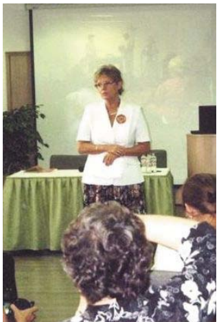
Dr. Hoffman Rózsa előadása a külföldi magyar nyelvtanároknak a győri továbbképzésen

Sajnos ezen a győri tanfolyamon nem tudtunk a kezdettől fogva részt venni, de már jelen voltunk Dr. Hoffman Rózsa , magyar