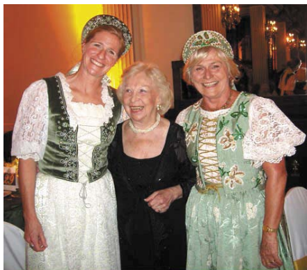
3 nemzedék együtt szórakozik...

100 éves jubileumára emlékeztette - „Egy továbbélő hagyomány” jelszóval hívogatta magyar és argentin barátait. Természetes, hogy minden, ami továbbél, mint társadalmi életünk fénypontja, a Cserkészbál, ennyi év alatt változásokon esik át. Ma már nehéz, de nem lehetetlen, hogy három generáció együtt jól érezze magát egy bálban, ami ezen az ideji cserkészbálban majdnem sikerült.