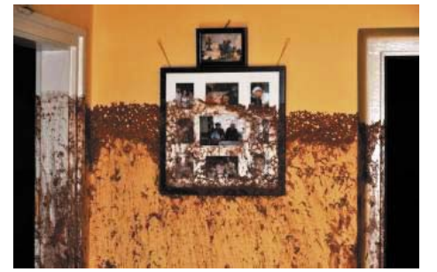
Az épen maradt házak belsejében sem menekült meg semmi

Igazat megvallva, a tragédiát még nem sikerült a közvéleménynek feldolgozni.