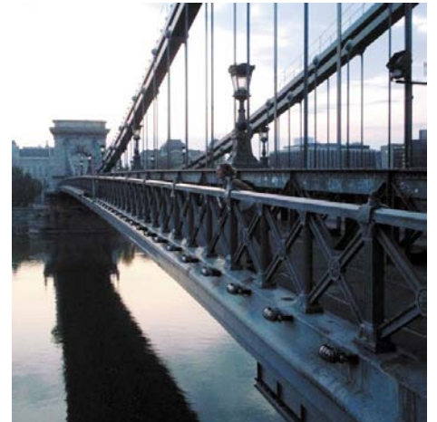
Tükröződés