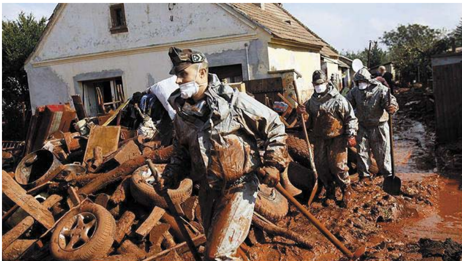
A gyilkos iszaptól káros gázok is áradnak

(Budai F. - Köszönet Jeszenszky Géza. Képanyag köszönet Filipánics Mihály www.lavoz.com.ar )