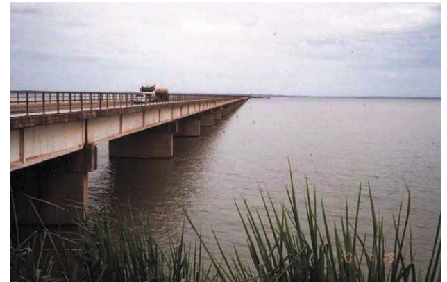
Benyomáskeltő, 14 km hosszú híd visz át a Paranán, Mato Grosso-ba