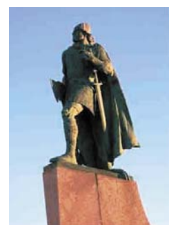
Leif Erikson Fotó archív