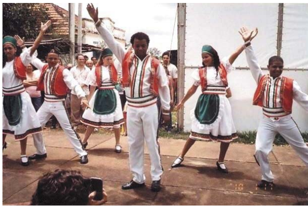
Az Árpádfalviak - nem saját hibájukból! - olasz zenére járnak magyar táncot...

Háromnapos ünnepséget rendeztek. Első nap ünnepélyes mise, utána magyaros ebéd, rétes és beiglivel utótételnek. Az ebéd alatt sorsolás, ahol a nyeremények fél disznók voltak - szerencsére a mi számunkat nem húzták ki. Ebéd után magyar tánc. - Te jó ég, milyen lesz!?