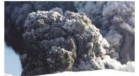
A dél-izlandi Eyjafjallajokull vulkánleccser kitörése 2010. április 17-től kezdve hamuval szennyezi a levegőt kontinenseken át