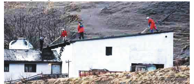
A hamu mindent befed - a tetőkről le kell kaparni a kormot (Seljavellir, Izland, 2010. ápr. 18)

[Gidon Spiro keményvonalas baloldali, de a kommunistákat nem kedveli. A Jobbikot sem. Évtizedek óta küzd a palesztin területek izraeli megszállása, az izraeli zsidó rasszizmus ellen, és Mordeháj Vaanunu barátjaként az izraeli atomerzénél fölszámolásáért. Jelen írásában frappáns választ ad a magyarországi választások eredménye miatt izraeli újságíróknak és politikusoknak.]