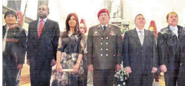
Argentína jelenlegi baráti köre. Cristina Fernández de Kirchner, Argentína elnöknőjét körülveszik elnöki elvtársai b.-j.: Evo Morales (Bolívia), Roosevelt Skerrit (Dominikai Köztársaság), Hugo Chávez (Venezuela), Raúl Castro (Kuba), Daniel Ortega (Nicaragua)

- Argentínában az elmúlt hetekben lelki nyugalom nem rázta fel semmi nagy, új politikai esemény. Minden harc, vita, feljelentés, áskálódás már a 2011-es választásokra céloz... Ha figyelmesen olvassuk a napilapokat vagy nézzük a tévében a híreket, fényképeket, egyértelműen megállapíthatjuk, hogy a Kirchner kormánynak minden igyekezete, pénze és feltűnő külföldi szereplése ellenére sincs komoly esélye, hogy 2011-ben újraválásszák. Sajnos eddig még egyetlen vezéregyezés sem tűnt fel országunk két egén. Az ellenzéki pártok halogatják az egyezkedést és a társulást. Tehát türelemmel reménykedjünk egy jobb jövőben.