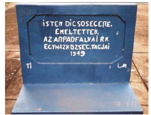
Ez ll a templom eltti kereszt talpazatn, amely mr 1949-ben keletkezett: ISTEN DICSSGRE EMELTETTK AZ R-PDFALVAI RK. EGYHZKZSG TAGJAI 1949

Tbb tnyez jtszott kzre. Jelentkezett egy szrzsg, s ezzel a fld meddsege. rpdfalvnak s krnyknek a fldje valamikor a Paran foly rterlete volt. A termfld nagy rsze ersen homokos volt. A homok pedig, es hinyban, ki-get mindent. A kzeli serd kiirtsa is rossz kihatssal volt a klmra, kevesebb es esett.