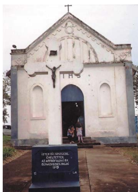
A 20-as vekben plt Szent Istvn templom rpdfalvn