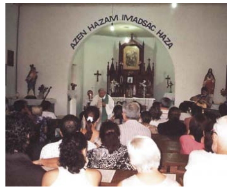
Az oltr fltti mondat, amit kijavtottunk, helyesen gy: AZ N HZAM IMDSG HZA

Krve krjnk a Nagymltsgu Urat hogy a felptshez szksges 3500 mil-reist, iskolsknyveket s vente egy csekly tmogatst adni sziveskedjk. Azon remnyben, hogy Nagymltsgu