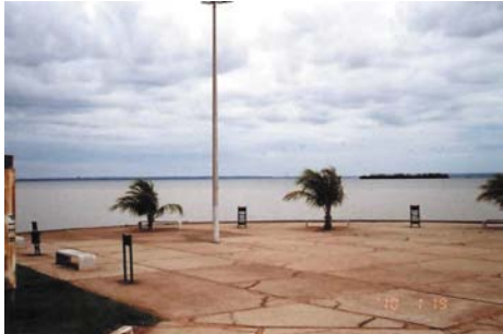
A Paran folyam ma. Itt So Paulo s Mato Grosso brazil llamok hatra

1920-ban létesült egy magyar település São Paulo állam legnyugatibb részén, 884 km-re São Paulo várostól a Paran folyótól nem messze. Az alapító magyar bevándorlók Árpádfalvának nevezték el. A magyar telepesek elször is a forró, 40-42 fokos hsget kellett megszokjk. Aztn meg kellett tanuljk, hogy itt nem termelhetnek azt, amihez szokva voltak otthon, Magyarorsgon.