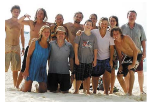
A Zaha-Dry kln Zanzibron

Madagaszkrba, ami lete nagy vgya volt. Mr most lmodozunk egy jabb hasonl csaldi kirnduls megvalstsn... Adja Isten, sikerljn!