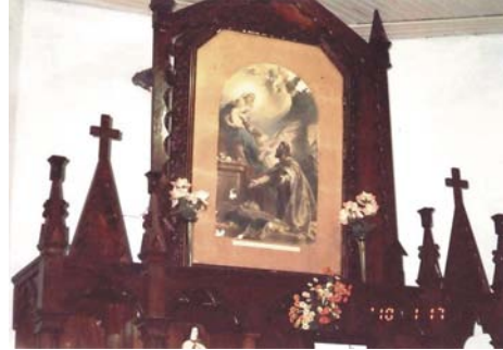
A templom oltrkepe a hres Benczr Gyula (1844-1920) festmny: Szent Istvn feljnja Magyarorsgot Szz Mrinak

rpdfalvn 181 magyar csald telepedett le. Ebbl 138 csald Erdlybl, 41 Dlvidkrl s 2 Magyarorsgrl. Egy ksbbi adat 1500 llekrl beszél. A So Paul-i magyar bencsek rendszeresen lejrtak rpdfalvra miszni, esketni, keresztelni.