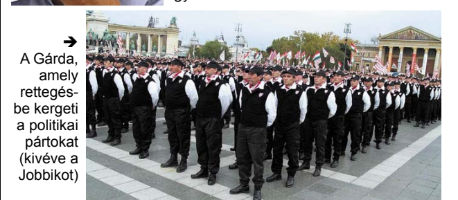
→ A Gárda, amely rettegettségbe kergeti a politikai pártokat (kivéve a Jobbikot)

← Gigászi földadat: Hogy oldom meg a problémahalmazt? Adósság, munkanélküliség, nulla fejlődés... Orbán Viktor leendő miniszterelnök: „Szívem mélyén tudom: életem legnagyobb feladata előtt állok”.