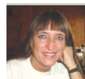
Compilado por Henriette Várszegi

Vemos que los más pequeños ponen todo su empeño y eso reditúa en los resultados. ¡Adelante, nomás! ¡Que siga este buen comienzo de temporada!