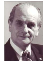
El poeta y editor Tibor Tollas

El poeta húngaro Tibor Tollas nació en Nagybarca, Hungría, el 21 de diciembre de 1920 y murió en Munich, el 19 de julio de 1997. Entre sus antepasados ilustres hubo militares que sirvieron bajo el mando de Lajos Kossuth , héroe de la Guerra de Independencia de 1848. Se graduó en la Academia Militar Ludovica, en Budapest y, en 1941, ya estaba enlistado como teniente, sirviendo durante la 2ª Guerra Mundial como oficial. En 1945 sufrió severas lesiones en ambas manos. Quedó arrestado por acusaciones falsas por el temido servicio secreto ÁVO en 1947, y el Tribunal del Pueblo lo condenó a 9 años de prisión (cumplidos en Budapest, Vác y el campo de trabajos forzados en las minas de Tatabánya). Fue liberado en 1956. Durante la Revolución, sirvió como oficial de enlace. Luego del aplastamiento de la Revolución por las tropas soviéticas, huyó a Occidente y se estableció en Munich, donde fundó con sus ex compañeros de prisión uno de los mayores periódicos de la emigración, "Nemzetőr" (El Centinela Nacional), cuyo director fue durante 40 años.