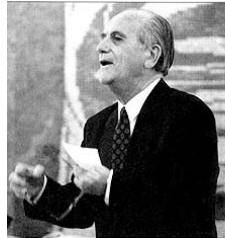
Excelente organizador, supo interpretar sus propios poemas con un fuego inigualable, transmitiendo emoción y pasión

su zapato con una nueva capa de jabón. Mientras se iban escribiendo los diversos párrafos, el traductor los memorizaba y los pasaba a la próxima celda. Después de un tiempo, docenas de versiones del poema circulaban por la cárcel y cada una era evaluada y votada por todos los internos. Después de decidir qué traducción de Whitman era la mejor, los presos decidieron empezar de nuevo con un poema de Schiller.