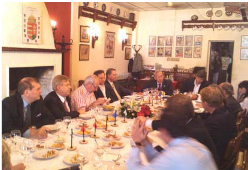
Una parte de los presentes rodeando la mesa festiva en el Club Hungaria

Como ya lo informamos a nuestros Lectores (AMH enero-febrero 2009), debido a los buenos oficios del embajador D. Mátyás Józsa y de la presidenta de FEHRA, Eva Szabó de Puricelli, la colectividad húngara fue aceptada a ingresar al prestigioso Club Europeo como miembro integrante.