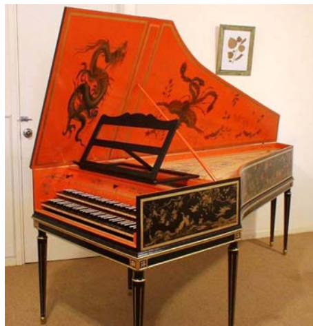
El hermoso clave Ruckers 1612