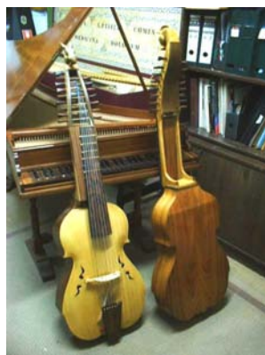
Además de las cuerdas habituales para el arco, el baryton incluye cuerdas adicionales en la parte trasera para pulsar