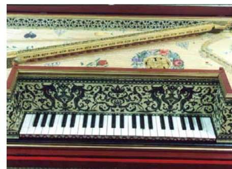
Detalle: El teclado corto del muselaar, instrumento prevaleciente por excelencia en los salones de los S. XVII y XVIII

fabricación de Pérez Robledo, luego de lo cual pasó a otro instrumento del mismo luthier, el muselaar , de teclado más corto y parecido al virginal, que se utilizaba en Holanda en conciertos familiares en el siglo XVII. Tocó fragmentos del manual de Stark, editado en Sopron, Hungría, en 1690, y una obra inglesa del Virginal Book, llenando el salón de un clima muy especial.