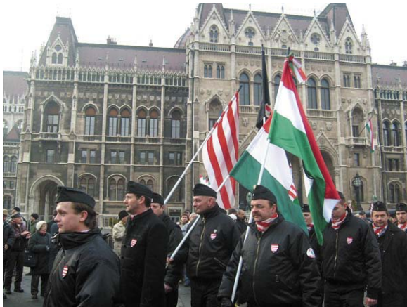
Szipmátia tüntetés a Magyar Gárda Egyesület mellett, a Parlament előtt (2009. január 17). Fotó Szabad R riport Tudósító Iroda

Közben folyik az áldatlan vita a „fasiszta” Magyar Gárda körül s a Böszörményi út-Nagyenyed utca sarkán lévő,