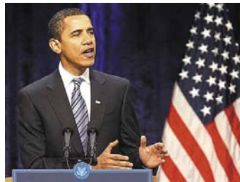
Az új elnök hatásos beköszöntő beszéde nem maradt el a kampányolása alatt elhangzottaktól

Még azok, akik a választási hadjárat alatt előítéletek nélkül, pártatlan figyelemmel kísérték a republikánus pártjelölt, John McCain szenátor és a demokrata pártjelölt, Barack Obama szenátor közötti vitát sem lehettek bizonyosak afelől, hogy a két jó jelölt közül melyiket fogják megválasztani. Az észak-amerikai polgár hazafias érzelmű, és amikor szavaz, az ország érdekeit tartja szem előtt (akárcsak mi?). A polgároknak volt alkalmuk, hónapokon keresztül megismerni jelöltjeiket. Nem egy jelölt ellen, hanem egy jelöltre szavaztak (ellentétben velünk, Argentínában?). Ezért nem lepett meg az a leírhatatlan lelkesedés, együttérzés,