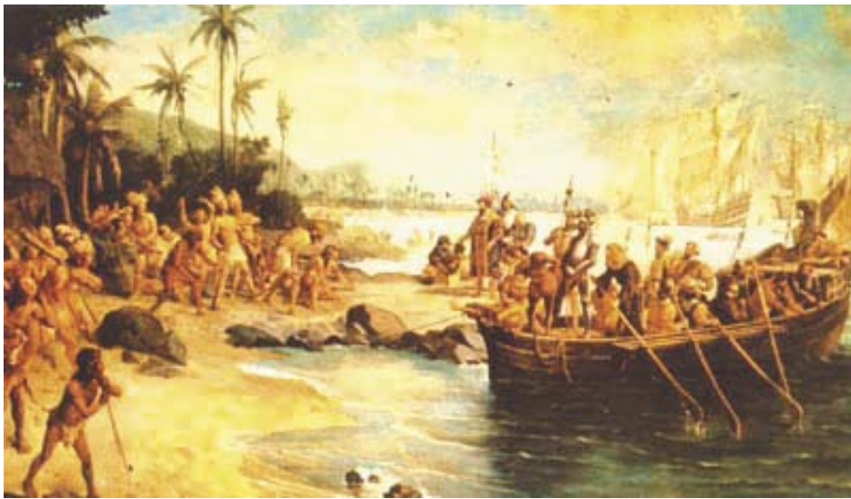
Cabral portugál felfedező érkezése 1500. Híres festmény a brazil Nemzeti Múzeumban

Brazília egész gazdasági élete a rabszolgák munkájától függött, nemcsak a kezdetben, de még hosszú időn át. Óserdőirtás, hatalmas területek beültetése cukornáddal, kávéval, kakaóval, a termékek feldolgozása, szállítása - mindmind rengeteg munkáskezet kívánt.