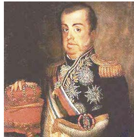
VI. Dom João portugál király Angliával levelet vált rabszolga ügyben

Dom João VI. azt válaszolta, hogy nagyon szívesen, de előbb az angolok fizessék meg Portugáliának az 1814-ben elfogott rabszolgaszállítmányait, mert az nekik komoly pénzvesztést okozott. Ha ez megtörténik, 8 év alatt fel tudnak szabadítani minden rabszolgát. Ha ez a jóvátétel nem történik meg, akkor is felszabadítják a rabszolgákat, de ilyen gyorsan nem lehet, hanem csak lépésről lépésre, ahogy a helyzet megengedi.