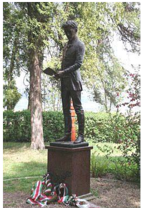
A költő feltételezett elesténe helyén, Fehéregyházán (Erdély, Maros megye, románul Albești, 1924-ig Feriház, németül Weißkirch bei Schäßburg)

(Megjelent a Délamerikai Magyarorság 1981. március 15-i számában)