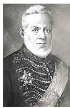
Senador Vergueiro: „Semmi rabszolgát! Szabad embert minden munkára!” - Beindítja az európai emigrációt

Ugyanakkor persze Brazíliában is már komolyan tárgyalt téma volt a rabszolgaság eltörlése. Egy pár felvilágosult fej, köztük a portugál születésű és Coimbrában végzett jogász, Senador Vergueiro (1778-1859), maga is több kávéültetvény tulajdonosa, 1803-ban jön át Brazíliába.