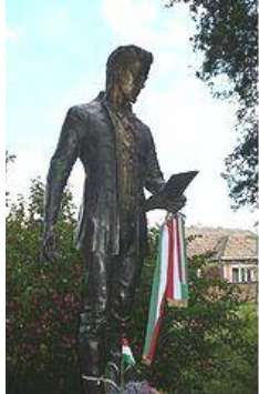
Petőfi emlékhely a segesvári csata (1849. július 31) emlékművének

„A vélemény szabadsága mindenekelőtt a vélemény alkotásának és kinyilvánításának a szabadsága mindenki számára, még és különösen akkor is, ha ez a vélemény nem egyezik a kormányzók véleményével. Az az ember, akinek nincs joga nemet mondani, csupán egy rabszolga.” (Arthur Koestler) „Egy szabad államban helyénvaló, ha mindenki azt gondolja, amit akar, és mindenki azt mondja, amit gondol.” (Spinoza)