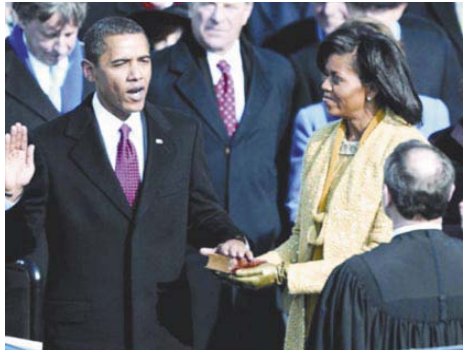
Az Észak-amerikai Egyesült Államok 44. elnöke felesküszik a Bibliára

Január 20-án, reggel 9 órától este 10 óráig bekapcsolva tartottam az CNN amerikai televízió direktadását. Megszakítás nélkül, egyenesen Washingtonból közvetítették Barack Obama, Észak-Amerika új elnökének hatalomátvételét és ünnepélyes beiktatását, részletes pontossággal, sorrendben, tárgyilagosan. Egy dolog az, amikor az ember tolmács által hallgatja a közvetítést, vagy később az újságok hasábjain a történetekből, a beszédekből részleteket kiemelve értesül az írók, politikai szakértők szájíze szerint. Más az, amikor eredeti nyelven, kitűnő dikcióval, váltakozó bemozdítással hallod és érted meg. Az új elnök székfoglaló beszédét eredeti szöveggel hallani ennél még meggyőzőbb. A technika vívmányai segítségével az egész földkerekségen min-