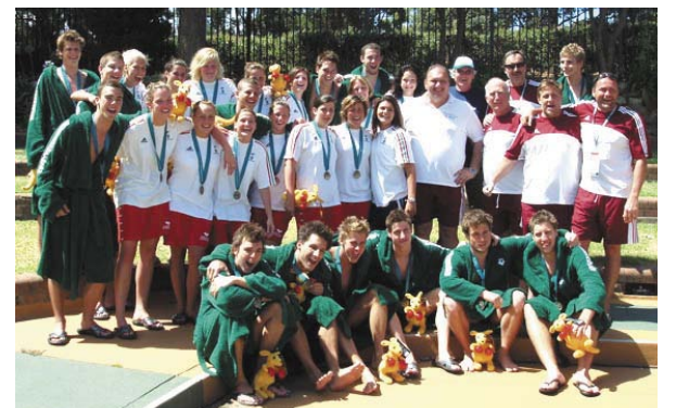
A két győztes ifjúsági magyar aranyérmes csapat edzőikkel.

Az előmérkőzések után a fiúk és lányok döntőmérkőzéseinek eredményeként aranyérmes lett Magyarország! A sikerekhez