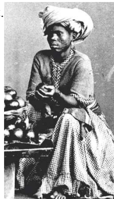
Szolgáló a kolonialis időkben

Ausztria több megértéssel volt. Hiszen a két uralkodóház között rokoni kapcsolat volt (l. az AMH előző számainak e rovatában az erről a témáról megjelent írásokat. Szerk.). VI. Dom João király fiának, I. Dom Pedronak felesége, Leopoldina Habsburg hercegnő I. Ferenc osztrák császár lánya volt. Az egyik osztrák diplomata azt írta haza az osztrák kancelláriának, hogy bizony: „Brazília-