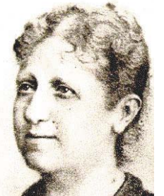
(Folyt. a következő számunkban).

Izabella császári hercegnő, aki apja, II. Dom Pedro távollétében helyetteseként az Aranytörvényt aláírta: „Tegnap aláírtam a Lei Áureát...”