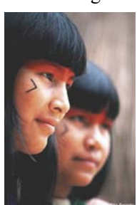
Két indián leányka

indian nem fosztotta ki a természetes éléskamráját: egy halat kifogott, ezzel jól lakott ő meg a családja, aznap többet nem