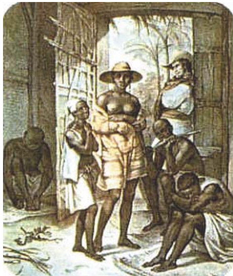
Rabszolgák és a gazda, hátul jobbra

Mindjárt a felfedezés után a portugál földnek első elfoglalói rájöttek, hogy a „helybelieket”, az indiánokat, nem lehet munkára befogni. Az indián nem tud, de főleg nem akar másnak dolgozni. Az indián nem is érti, hogy miért kellene másnak dolgoznia? Neki az erdő mindent megad, de azt neki kemény munkával kell előteremteni, vadászattal, csapdák felállításával, halászáttal kell az erdőkből, folyókból megszerezni. Ugyanakkor az