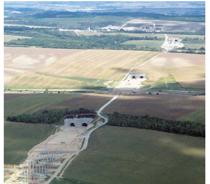
Az M6-os autópálya Budapest-Dunaújváros-Pécsi vonal még csak részben kész. Az autópálya bűzamezőkon, szőlőbirtokokon át vezet. A műholdfotón látható szakaszon alig vannak magasabb dombok. Több alagutat látni, elől egy viadukt építésének a pilléréi

„Szakértők szerint kézenfekvő dolog, hogy a dombok be- vágásából nyert földet betéríthették volna a „völgyhidak” helyére, és így gazdaságosabb lett volna a beruházás. A lankás dombokban teljesen fölösleges alagutakat fúrni, mivel néhány helyen csak pár méter föld marad az alagút felett. A tervezéskor nem vették figyelembe a löszös, agyagos talaj azon tulajdonságát, hogy esős időben megszívja magát, és könnyen megindul, roskad. Csak idő kérdése, hogy mikor fog beomlani az M6-os alagútja.”