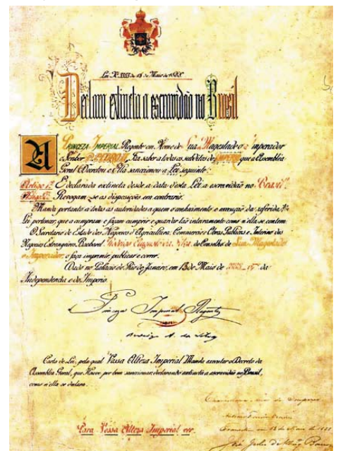
Az oly fontos „Aranytörvény”, amely megparancsolja a rabszolgák teljes felszabadítását

1888 „Lei Áurea” - Az „Aranytörvény” - teljes rabszolga-felszabadítás.