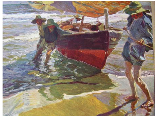
„Partraszállás” (1916), Joaquín Sorolla y Bástida spanyol impresszionista festő műve (Valencia 1863 - Cercedilla, Spanyolország 1923)