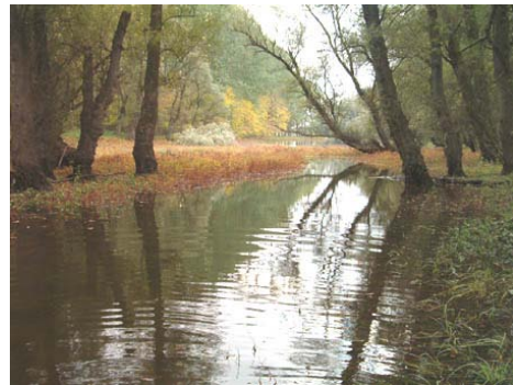
Paz y tranquilidad al llegar la noche en el bosque de Gemenc, cerca de Baja