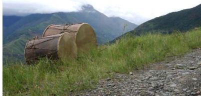
Nostalgias ancestrales en los ritmos

Hobbies: música, cine, arte, literatura, fotografía. La idea de viajar como mochilera por América latina surgió hace unos seis meses, y de a poco fue convirtiéndose en un proyecto real, basado en su motivación: viajar, conocer y escribir.