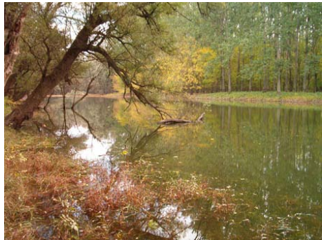
Apacible atardecer otoñal. Brazo muerto del Danubio cerca de Baja, en el bosque de Gemenc

Si sigue así, esta sociedad va a derrumbarse y desaparecer, pues no se pueden convertir en leitmotiv de nuestras vidas los datos del PBI o los movimientos del mercado de valores. De este modo no subsistiremos, porque no tenemos respuestas para nada importante.