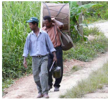
Rasgos aún bien notables de la raza de origen...

to de por sí ya era totalmente distinto al de los bolivianos del Altiplano: su tez era mucho más oscura, sus labios más gruesos, su pelo más enredado, pero mantenían los típicos ojos achinados de los habitantes de Bolivia. Desde que los saludamos se mostraron muy cálidos y simpáticos y nos invitaron a conocer su pequeño pueblo.