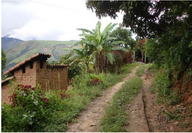
Subiendo la ladera...

Llegamos a Tocaña, pueblo de pocas casas ubicado en la ladera de las montañas, y nos encontramos nuevamente con algunos de los músicos que habíamos conocido en Coroico. Uno nos contó que la comunidad estaba formada por 200 personas, todas descendientes de los antiguos esclavos traídos de África para trabajar en las minas de Potosí. Algunos esclavos habían logrado escapar y se asentaron en ese sector del país, bien escondido, y mantuvieron durante siglos las costumbres y tradiciones importadas de su gran continente. Hoy en día siguen celebrando sus fiestas típicas y mantienen viva su cultura a través de los bailes y de la música.