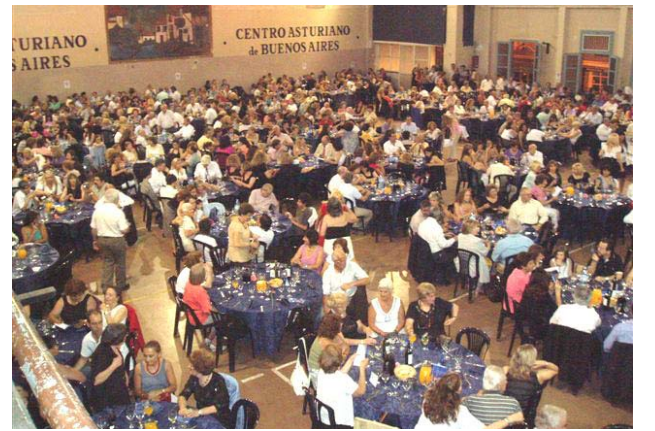
El público colmó el gran salón-comedor del Centro Asturiano en Vicente López

El gran salón del Centro se llenó de alegre público, parientes, amigos y simpatizantes de los participantes.