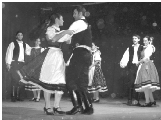
Conjunto de Danzas Tündé kert

Pero el final de la fiesta de aniversario dio inicio a otra actividad, muy esperada. Como se había anunciado, en dicha jornada comenzó el Campeonato Intercolectividad de Canasta. Los entusiastas y esperanzados participantes se reunieron en el salón Petöfi en torno a las mesas de juego, esperando tener suerte y disfrutar del encuentro con los demás competidores.