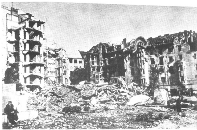
Bulevard Margit - 1945

En la Biblioteca húngara. Ver dirección en Nuestras Instituciones, última página del periódico).