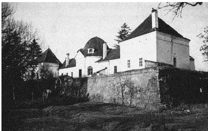
A Hallerek egykori fehéregyházi kastélya. 1930. Kroner, Michael-Ludwig, Rosemarie: Weisskirch: eine siebenbürgische Gemeinde an der Grossen Kokel . München, 1997 után

nas éveinek elején még a válaszüti kastély faskamrájában őrizték). Hasonló sorsra jutott a Hallerek fehéregyházi rezidenciája, az olaszbástyákat utánzó, négy saroktoronnyal és bástyás, külső védőövvvel is erősített együttes, amelynek építéséről 1626 táján – Bethlen Gábor fejedelem sokkal ismertebb, hasonló építkezéseivel egy időben – szólnak a források. 3 A múlt század második felében hatalmas, üres telkén kenderfeldolgozó üzem raktározta a nyersanyagát. Csak gyanítjuk, hogy akkoriban pusztult el a szamosfalvi egykori Mikola kastély, 4 biztosan akkor a magyarfenesi br. Jósika kastély 5 is. Az utóbbi körül a földreform mintegy 100 kataszteri hold szántót, kertet, kaszálót hagyott meg, s ez távolról sem volt elég a fenntartására. A mintegy 40 kh belsőséget a kastély tulajdonosa 25 telekre osztva a falu lakóinak adta el, az épületből pedig építőanyag lett. Az 1930-as években már nyoma sem látszott. A keresdi Bethlen-kastély fenntartására mintegy 200 hektárnyi, nagyrészt erdőbirtok maradt. 6