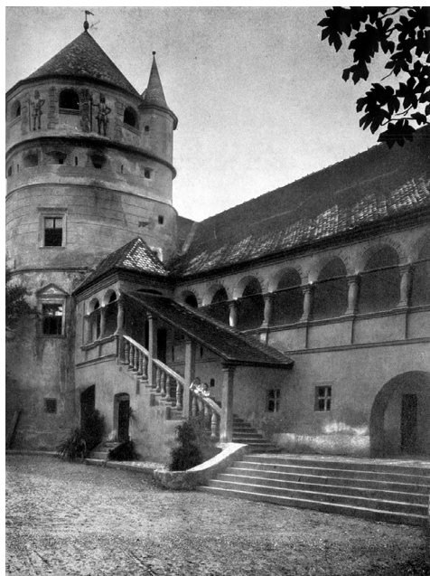
Keresd. Bethlen-kastély. 1930-as évek. Rados Jenő: Magyar kastélyok . Bp., 1939 után

nünk. Ezek egyike a lejtősen emelkedő udvar hátsó, északnyugati sarkában emelt, a szintkülönbség miatt hatalmasnak tűnő, kinézésében leginkább szász templomvárakra emlékeztető, tornácos torony, melyet az eredeti tulajdonosoknak annak idején a 17. században csupán ölnyi (1,89 m) magasságra sikerült felépíteni, s amelyet így Csonka bátyának neveztek a 18. században is. Mellette még azt az ún. „lovagtermet” emelnénk ki, amelynek egyik funkciója a szocializmus utolsó évtizedében az lett, hogy ott Hargita megye akkori vezetői kellemesen, kíváncsi szemektől távol kikapcsolódhassanak. 22 Az épület Hansa-városházára emlékeztető külseje és belseje olyan, hogy eredeti tulajdonosai rá sem ismernének, ha feltámadnának. Erdélyben szokatlan építészeti formái tolakodóan borítják árnyékba az együttes sokkal szerényebb, de hiteles 17. századi részleteit. Régészeti kutatása – a marosvásárhe-