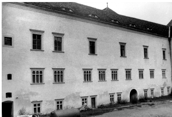
Fogaras. Bethlen Miklós kancellár egykori börtönének a szárnya.