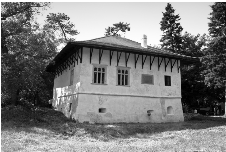
Marosillye. Az egykori Veres Bástya.

1990 után ezt, a romániai műemlékjegyzékben nem is szereplő épületet a dévai Szent Ferenc Alapítvány szerezte meg, s az alapítvány vezetői felismerve a lehetőséget, magyarországi támogatással restauráltatták és a „nagy fejedelem” emlékmúzeumává, kulturális központtá alakították. A Bethlen Farkas által építtetett bástya eredetileg egyetlen helyiségből és egyazon fedél alatt megbúvó nyitott védőteraszból állott, a kutatások feltárták és helyreállították szerény falfestmény-maradványát és farragványait is. Nem sikerült viszont befejezni régészeti kutatását, így még mindig várat magára tereprezendeje. Modern lépcsője sem tökéletes megoldás, és bármikor kicserélhető egy, a források tanúságához jobban illővel. Szépséghibája ennek a helyreállításnak az is, hogy környezetében az egykori birtokközpont együttesétől elválasztott 19. századi br. Bornemisza-kúriára (2000 utánig városi kórház), akárcsak az egykori uradalmi magtár impozáns, 18. századi épületére megfelelő hasznosítás és védelem híján pusztulás vár. Végezetül csupán utalok a váradi fejedelmi palota elkezdett rekonstrukciójára, a legutóbbi évek leglátványosabb hazai kezdeményezésére mint valóban európai színvonalú, hiteles restaurálás ígéreteré.