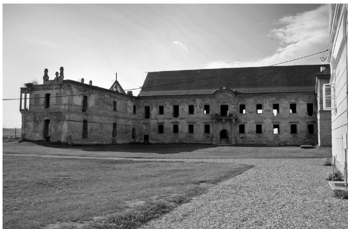
Bonchida. Az északi és a nyugati szárny.

százados koronáikat [...], s a szivárvány minden színét váltják a bokrok lombjai, mintha palettáról alakította volna ki összhangjukat valami ismeretlen festő. Talán mégis emberkéz műve mindez, mert egyszerre hídra kanyarodik fel a kocsi, dögve fut boltozatos áthajtó alá, melynek tetején görnyedő titánok sziklákat emelnek, kőből faragva maguk is, akár hajladozó szobortársaik; hatalmas díszudvaron félkört írnak le a paripák, míg lihegve megtorpannak [...]. A csattogás elhalkul, némaság borul a kastély udvarára, a kerek bástyákra, a karcsú istenszobrokra, a halványsárga fa-