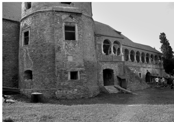
Keresd. Bethlen-kastély. 2005.

nünk. Ezek egyike a lejtősen emelkedő udvar hátsó, északnyugati sarkában emelt, a szintkülönbség miatt hatalmasnak tűnő, kinézésében leginkább szász templomvárakra emlékeztető, tornácos torony, melyet az eredeti tulajdonosoknak annak idején a 17. században csupán ölnyi (1,89 m) magasságra sikerült felépíteni, s amelyet így Csonka bátyának neveztek a 18. században is. Mellette még azt az ún. „lovagtermet” emelnénk ki, amelynek egyik funkciója a szocializmus utolsó évtizedében az lett, hogy ott Hargita megye akkori vezetői kellemesen, kíváncsi szemektől távol kikapcsolódhassanak. 22 Az épület Hansa-városházára emlékeztető külseje és belseje olyan, hogy eredeti tulajdonosai rá sem ismernének, ha feltámadnának. Erdélyben szokatlan építészeti formái tolakodóan borítják árnyékba az együttes sokkal szerényebb, de hiteles 17. századi részleteit. Régészeti kutatása – a marosvásárhe-