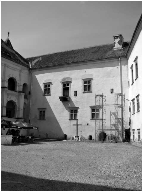
Fogaras. A kápolnás szárny. 2009.

tartó háznak szomszédjában... [ti. tartottak fogva]. Jó alkalmas tömlöc lett volna, de a vár emésztője éppen alatta menvén el, nyirkos volt, bűdös is volt, egy-két hét alatt minden megzöldült a penésztől benne ” – összegezte rezignáltan a ma makulátlan s a restaurálásnak köszönhetően kőből faragott hibátlan reneszánsz ablakkeretes helyiségre vonatkozó benyomásait Erdély egykori kancellárja. 11 A fogarasi restaurálás, amelynek kétes hitelét aberráns eredményeivel már a régészeti kutatás is előrevetítette, 12 egy másik vonatkozásban is érzékletesen tükrözi a korát: az I. Rákóczi György által 1639–1640-ben kialakított kápolnát eredetileg kőkeretes kerek ablakok világították meg. Ezeket a 19. század végén még látni is lehetett az udvari homlokzaton. Mára a restaurálásnak köszönhetően nagy, 1970 után faragott „reneszánsz” ablakok meg szónoklatra ingerlő, alaptalanul odabiggyesztett vasbeton erkély díszíti ezt a homlokzatot, s csupán az építészeti felméréseken találunk rá az elpusztított, valóban késő reneszánsz fogantatású körablakok nyomaira. 13