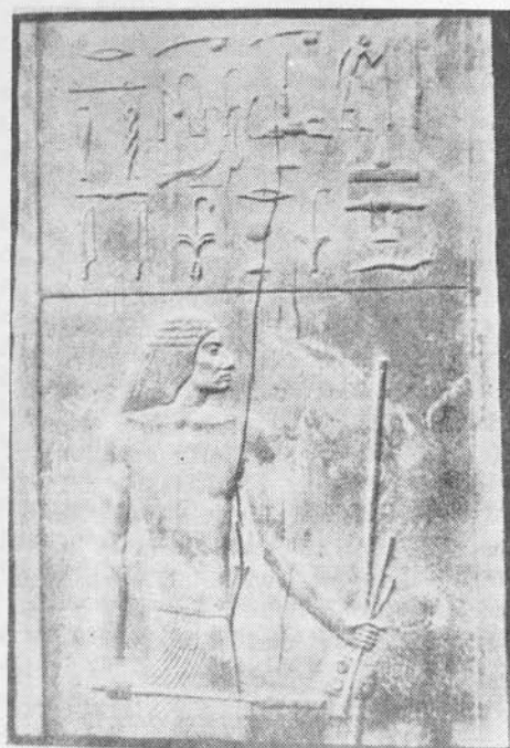
Íróeszközök a III. dinasztia korából (i.e. II. évezred eleje)