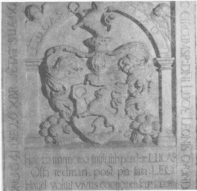
Lukas Leo sírkövének részlete (1641)

lan pompájú síremléket. Az Apafi-díszkoporsón kívül Nicolai összes eddig ismert művei az 1640—1658 közötti időszakból származnak. A továbbiakban azonban rámutatunk majd arra, hogy a mester már a 30-as évek második felében is sikeres szobrásztevékenységet folytatott.