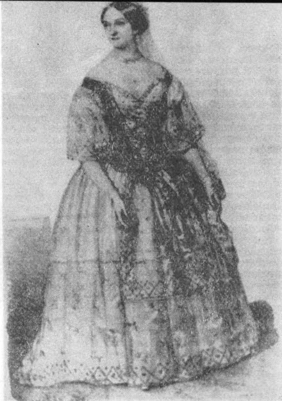
Hollósy Kornélia Erkel Ferenc Hunyadi László című operájának női főszerepében

ban román ének- és táncszámokat iktattak be műsorukba. Sőt Pály Elek Brassóban szereplő színtársulatával más nyelvekből fordított, és eredeti román színdarabokat adott elő, 1840. június 2-án pedig ő ragasztotta ki az első cirillbetűs, román szövegű színlapot, amelyben az Aldina sau Brashovul în alte parte lumii című színdarab előadását jelentette be (Orbán László: Adalékok a brassói színjátszás történetéhez . Kolozsvár, 1939).