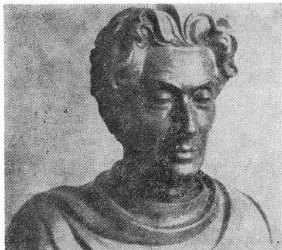
Rozvány Jenő szobra (ismeretlen művésztől)

és az annak befolyása alatt álló tömegszervezetekben tevékenykedett. Személye azt a történelmi folyamatot jelképezi, mely a régi szocialista mozgalom legjobb hagyományaitól a kommunista ideológiáig és pártig vezet, a szocialista párt kommunista párttá alakulása útján. Érdeklődését — a munkásmozgalomban való fellépésétől kezdve — elsősorban a paraszt- és nemzeti kérdés kötötte le, a legtisztázatlanabb problémák, amelyeknek a megoldása a munkásosztály küzdelmének kiszélesítését jelentette természetes szövetségesei, a parasztság és az elnyomott nemzetségek felé. Meggyőződéséért kiálló, sokoldalúan képzett, alkotó szellem volt, a legjobb értelmiségiek fajtájából, akiknél az elmélet és gyakorlat szervesen összefonódott. Az erdélyi munkásmozgalom akkori legismertebb, legnépszerűbb vezetői közé tartozott. Nagy történelmi eseményekkel, vívódásokkal és küzdelmekkel teli élete munkássága a hazai forradalmi mozgalom történetének olyan jelentős kérdéseivel függ össze, mint a kommunista párt megteremtése, programjának előkészítése, a harcának első időszakában felmerülő sok kérdés tisztázása.