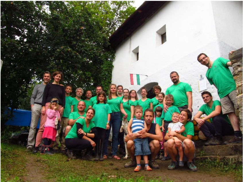
A PF feltáró csapata