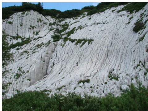
Karrbarázdák a Canin-fennsíkon

Utunk során egy egész napos kirándulás keretében feljutottunk a Canin-fennsíkra, ahol a társaság több részre válva ismerkedett a lenyűgöző felszíni karsztformákkal, valamint a fantasztikus gazdagságú növényvilággal. Sajnos a néhányak által tervezett Canin-csúcs meghódítása elmaradt, de a látottak mindenkiben így is mély nyomot hagytak.